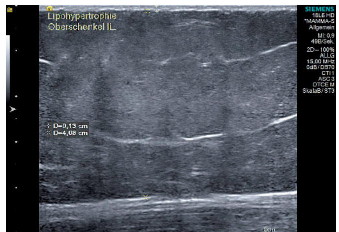
Abb. 4 Sonographisches Bild der Oberschenkel der Patientin mit Lipohypertrophie (auch hier waren linker und rechter Oberschenkel vollkommen identisch)