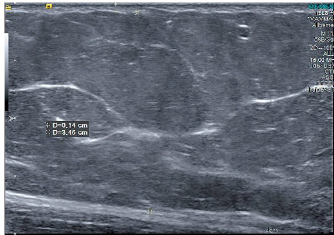
Abb. 8 Proximaler Oberschenkel der Patientin aus Abbildungen 5 und 6: Es zeigt sich das typische sonographische Bild eines Lipödems mit unauffälliger Cutis sowie mit Verdickung der Subcutis ohne Hinweis auf Flüssigkeit im Weichteilgewebe

vorhandene Ödem für die Beschwerden der Patientinnen verantwortlich ist?