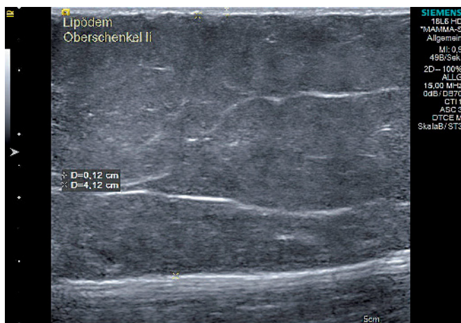
Abb. 2 Sonographisches Bild der Oberschenkel der Patientin mit Lipödem (linker und rechter Oberschenkel waren vollkommen identisch)

schmerzhaften Fettgewebes (13,14). Mit einem Artikel von Schmitz in der Zeitschrift „Gynäkologie“ über das „Lipödem – das dicke Bein der gesunden Frau“ kam 1980 wieder Bewegung in dieses Thema (15). Allerdings blieb die Rolle des Ödems – Ödem im Sinne von Flüssigkeitseinlagerung – ohne wesentliche Bedeutung! 1982 schrieb Brunner „Pathogenetisch handelt es sich um eine Störung im Verteilungsmuster des subkutanen Fettgewebes“ und weiter „Der Fettmantel hat eine sulzige