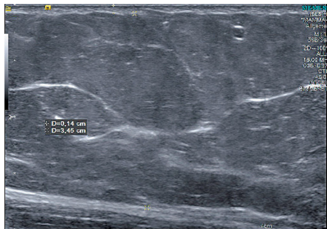
Abb. 8 Proximaler Oberschenkel der Patientin aus Abbildungen 5 und 6: Es zeigt sich das typische sonographische Bild eines Lipödems mit unauffälliger Cutis sowie mit Verdickung der Subcutis ohne Hinweis auf Flüssigkeit im Weichteilgewebe

vorhandene Ödem für die Beschwerden der Patientinnen verantwortlich ist?