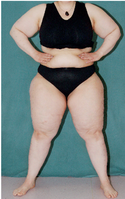
Abb. 1 Patientin mit Lipödem

(auch hier waren linker und rechter Oberschenkel vollkommen identisch). Das klinische wie auch das sonographische Bild ist quasi identisch mit dem der Patientin mit Lipödem.