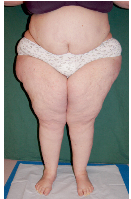
Abb. 3 Patientin mit Lipohypertrophie

Führt man den oben begonnenen historischen Blick auf das Lipödem fort, so stellt man fest, dass diese Erkrankung nach den beiden Publikationen der Erstbeschreiber Allen und Hines (1940 und 1951) in eine Art Dornröschenschlaf fiel. In den sechziger und siebziger Jahren gab es allenfalls unsystematische Einzelfallbeschreibungen zum Lipödem bzw. zu Erkrankungen des