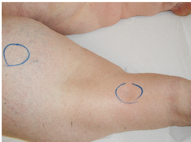
Abb. 6 Nachhaltige „Dellbarkeit“ des Lymphödems (unterer Kreis) sowie die „Nichtdellbarkeit“ des Weichteilgewebes der Lipödemregion (oberer Kreis).

Konsistenz und lässt auch über der Tibia auf Druck keine Eindellung zu“ (16). Für Gregl (1987) ist das Lipödem ein „mukoides Pseudoödem“. „Im Gegensatz zum kardialen und dystrophischen Ödem bleiben beim Lipödem nach Eindrücken keine Dellen zurück“ (17). Rudkin (1994) fand bei seinen Lipödempatientinnen ebenfalls nur „1/4 + edema in the pretibial area“ (1/4 + entspricht einer amerikanischen Ödemklassifikation und bedeutet „kaum dellbar“) (18).