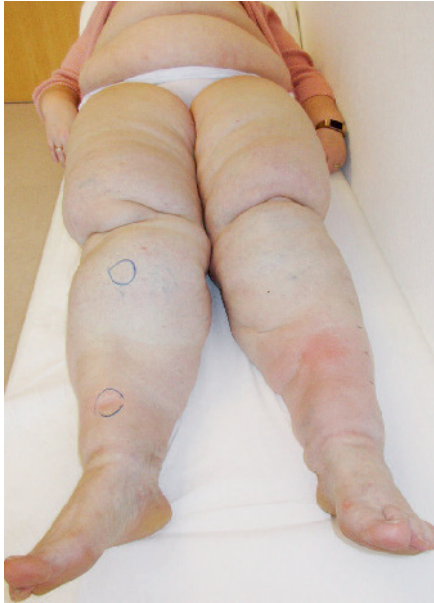
Abb. 5 Patientin mit einem distal betonten Lymphödem der Unterschenkel und Vorfüße und einem Lipödem, welches auf die Oberschenkel sowie die proximalen Unterschenkel begrenzt ist.

Konsistenz und lässt auch über der Tibia auf Druck keine Eindellung zu“ (16). Für Gregl (1987) ist das Lipödem ein „mukoides Pseudoödem“. „Im Gegensatz zum kardialen und dystrophischen Ödem bleiben beim Lipödem nach Eindrücken keine Dellen zurück“ (17). Rudkin (1994) fand bei seinen Lipödempatientinnen ebenfalls nur „1/4 + edema in the pretibial area“ (1/4 + entspricht einer amerikanischen Ödemklassifikation und bedeutet „kaum dellbar“) (18).