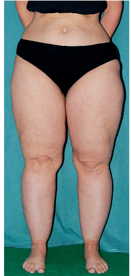
Abb. 4 Patientin, die von uns seit ca. 10 Jahren aufgrund ihres Lipödems ambulant mitbetreut wird.

strumpfhose sowie regelmäßig 2–3-mal wöchentlich durchgeführter sportlicher Aktivität ist die Patientin beschwerdefrei.