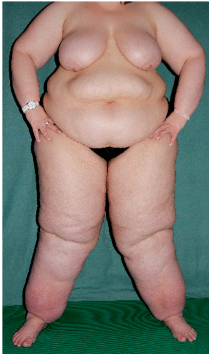
Abb. 5 Patientin, die über Jahre wegen eines Lipödems ambulant behandelt wurde.

Der Terminus „Lipolymphödem“ sollte daher aus dem lymphologischen Sprachgebrauch getilgt werden. Er sollte auch deshalb getilgt werden, weil er häufig missbraucht wird, um die von Lipödempatientinnen meist begehrte Manuelle Lymphdrainage rezeptieren zu können. Dass dieser Missbrauch auch von offizieller Seite gefördert wird, erinnert schon stark an ein Possenstück. Die Manuelle Lymphdrainage wird im Heilmittelkatalog – zu Recht – nicht als Indikation für das Lipödem aufgeführt. Dies macht medizinisch Sinn, da die Evidenz für ein relevantes Ödem (Ödem im Sinne von Flüssigkeit) beim Lipödem komplett fehlt. (Dieser Punkt ist Thema von Teil 2 dieser Darstellung). Diese -medizinisch vernünftige – Entscheidung wird allerdings in einem gemeinsamen Fragen- und Antworten-Katalog der Spitzenverbände der Krankenkassen und der Kassenärztlichen Bundesvereinigung (KBV) durch folgende Formulierung ad absurdum