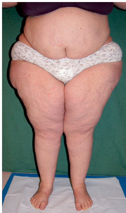
Abb. 1 Patientin mit Lipohypertrophie der Oberschenkel und der Beckenregion

Dieser Mangel an objektiven und klaren Diagnosekriterien führt auch dazu, dass keine verlässlichen Zahlen zur Prävalenz des Lipödems existieren. Weit überwiegend wird die Diagnose Lipödem von lymphologisch unerfahrenen Kollegen und fast noch häufiger von den Patientinnen selbst gestellt. In unserem Patientengut ist die Diagnose Lipödem (und noch häufiger die Diagnose „Lipolymphödem“) die mit Abstand häufigste Fehldiagnose, die wir täglich sehen. Alle – auch in wissenschaftlichen Publikationen – kursierenden Zahlen zur Prävalenz entbehren jeglicher Evidenz