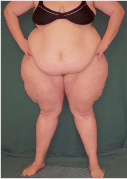
Abb. 2 Patientin mit der Diagnose Lipödem mit ausgeprägter Fettgewebsvermehrung isoliert im Bereich der Oberschenkel