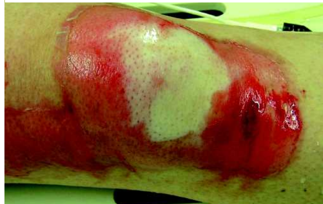
Abb. 5 Bei dieser Verbrennung am Knie zeigt sich nach Entfernung der Blasen in den mittleren Anteilen ein weißlicher Wundgrund mit reduzierter Schmerzhaftigkeit, entsprechend einer tief zweitgradigen Verbrennung. Die umgebenden Areale mit rötlichem Wundgrund und guter Rekapilarisierung sind als oberflächlich zweitgradig einzustufen.