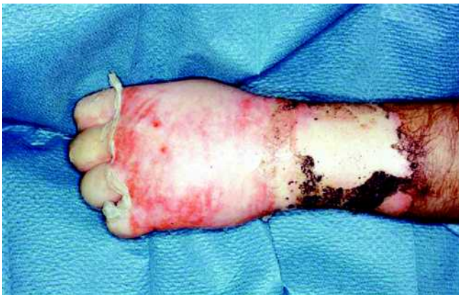
Abb. 3 Drittgradige Verbrennung am distalen Unterarm mit weißem Wundgrund. Der Nadelstichtest und Rekapilarisierungstest sind in diesem Areal negativ. Am Handrücken findet sich eine tief zweitgradige Verbrennung; die Verbrennung reicht bis in tiefe Anteile der Dermis; es findet sich noch partiell ein roter Wundgrund; eine Rekapilarisierung ist aber bereits nicht mehr feststellbar.

Die Bestimmung der Verbrennungsfläche kann anhand zweier Regeln erfolgen: Zum einen gilt, dass die Handfläche des Patienten 1% seiner Körperoberfläche entspricht. Eine weitere Möglichkeit ist die Einschätzung der Verbrennungsfläche nach der Neunerregel nach Wallace, wobei beim Erwachsenen den Körperregionen Anteile von 9% der Gesamtkörperoberfläche zugeordnet werden (☛ Abb. 6 ).