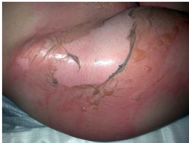
Abb. 1 Verbrennung 2a: Deutlich zu erkennen ist der hyperämische, feuchte Wundgrund.

Meist findet sich eine Blasenbildung und der Wundgrund weist eine wegdrückbare Hyperämie auf (Rekapilarisierungs-Test positiv). Der Wundgrund ist sehr schmerzhaft. Hautanhangsgebilde in tieferen Anteilen der Dermis sind intakt. Grad 2b, oder die tief zweitgradige Verbrennung (☉ Abb. 2) hat eine größere Tie-