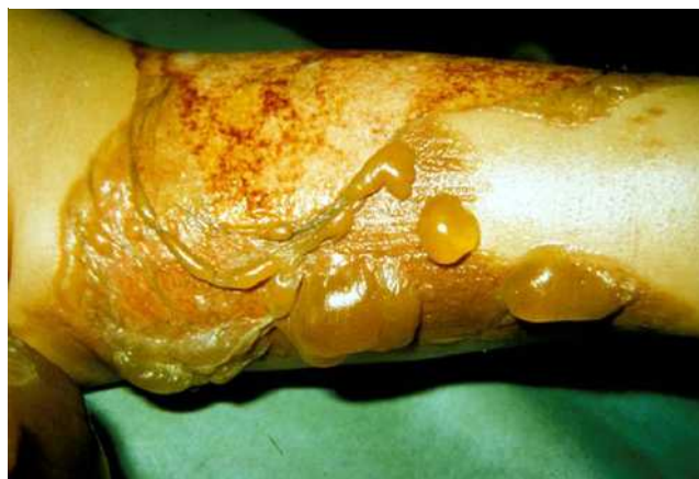
Abb. 2 Verbrennung 2b: Im Gegensatz zu der oberflächlich zweitgradigen Verbrennung finden sich teils dunkelrote, teils thrombosierte Areale.

fenausdehnung in die Dermis, ebenfalls mit Verlust der Epidermis, aber auch mit weitgehendem Verlust der Hautanhangsgebilde. Auch hier kann eine Blasenbildung auftreten. Der Wundgrund ist teils dunkel gerötet, teils weiß, die Rötung ist nicht wegdrückbar (negativer Rekapularisierungs-Test). Die Dermis ist nicht durchblutet. Es besteht eine geringe bis fehlende Schmerzhaftigkeit.