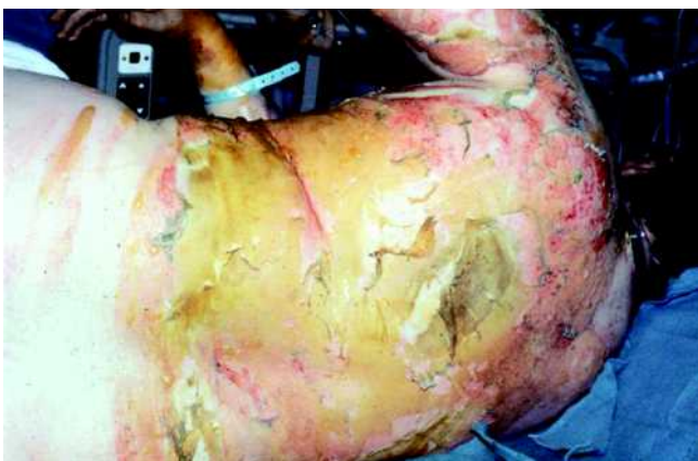
Abb. 4 Der charakteristische lederartige Wundgrund ohne Schmerzempfindung bei einer drittgradigen Verbrennung am Rücken vor der Wundreinigung.