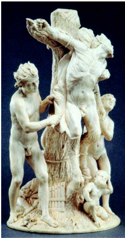
Abb. 2 Apoll schindet Marsyas. Adam Lenkhardt, Elfenbein 1644 (aus [9]).

heißt es bei Ovid. Das Häuten oder Schinden war eine Strafe mit Leiden, Todesfolge und Verlust der Person und zudem ist es eine Warnung vor Überheblichkeit gegenüber Göttern und Herrschern. Marsyas gilt als Metapher in Richtung Unterdrückung und Beherrschung des Menschen durch allmächtige Dominanz und Symbol für die Aufgabe der eigenen Gestalt und damit der Individualität. Das Schinden des Marsyas und anderer Märtyrer zieht sich durch die Jahrhunderte künstlerischer Darstellung [9] und findet sich in allen anthropologischen Reflexionen über Dominanz auf der einen und Selbstaufgabe auf der anderen Seite [4–7]. Der ganze Komplex wird gegenwärtig im Liebighaus Frankfurt in der großartigen Ausstellung über „Die Launen des Olymp. Der Mythos von Athena, Marsyas und Apoll“ aufgearbeitet und präsentiert [19].