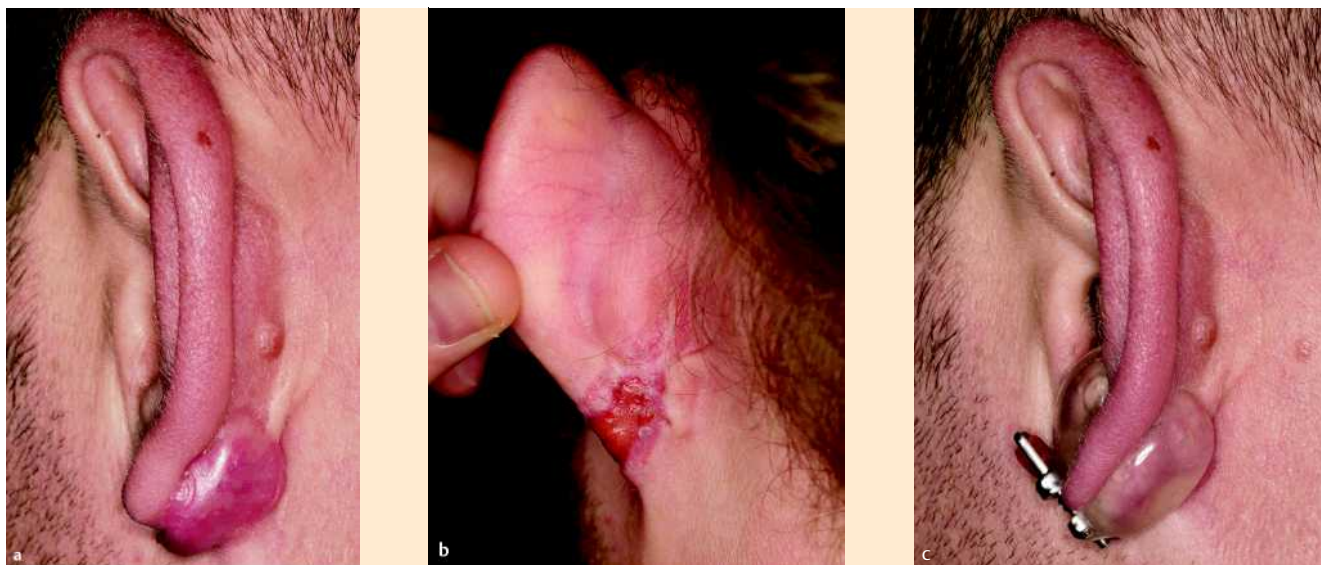
Abb. 9 a Keloid nach Ohrlochstich, b Zwei Wochen nach Planierung des Keloids mit dem CO 2 -Laser, teilweise Epithelisierung, c nach erfolgter Wundheilung Rezidivprophylaxe mit Ohrclip (Austernschalenepithetik).

Material selbst. Es kommt hierbei vermutlich zu einer verminderten Durchblutung und Angiogenese und somit reduzierter Kollagensynthese. Eine Änderung des Gewebedrucks, der Sauerstoffspannung oder Abgabe von Silikon in das Narbengewebe scheinen keine Rolle zu spielen.