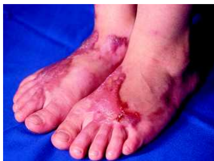
Abb. 1 Hypertrophe Narben an den Fußrücken eines 7-jährigen Mädchens nach einer Verbrennung 3. Grades in diesem Bereich.