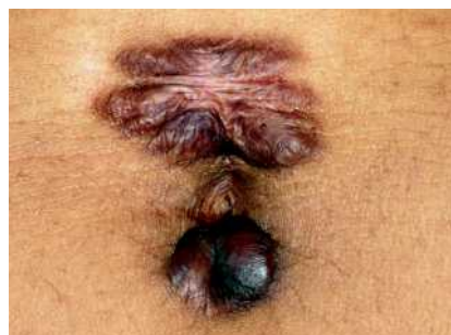
Abb. 4 Keloid am Bauchnabel nach Piercing.