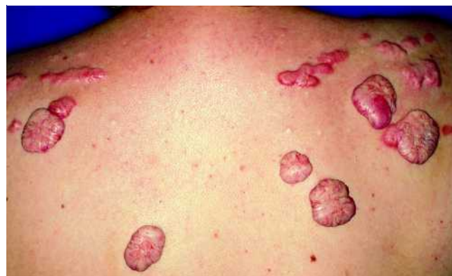
Abb. 5 Zahlreiche Keloide am Rücken einer 38-jährigen Frau bei Z.n. Akne in der Pubertät und positiver Familienanamnese für Keloide.