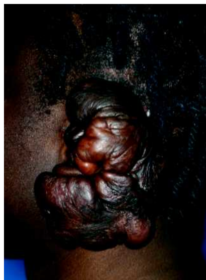
Abb. 3 21-jähriger Mann (Hauttyp VI) mit spontan aufgetretenem Keloid am linken Ohr.