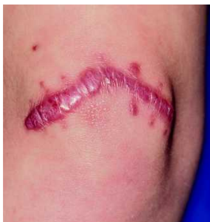
Abb. 2 Hypertrophe Narbe nach Exzision eines kongenitalen Nävus am Knie bei einem 10-jährigen Mädchen. Im Gegensatz zum Keloid bleibt die hypertrophe Narbe auf das ursprüngliche Wundgebiet beschränkt.