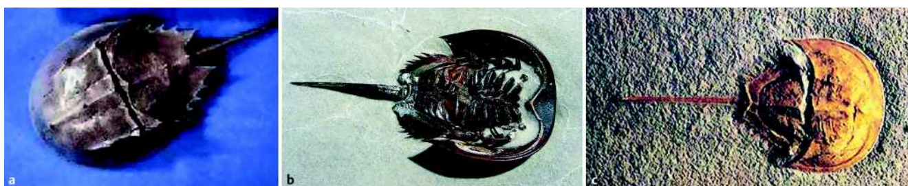
Abb. 2 a–c Unter- (a) und Oberseite (b) des heutigen Pfeilschwanzkrebses Limulus sowie versteinertes Exemplar einer verwandten Art ( Mesolimulus walchi ) aus den Solnhofen Plattenkalken (150 Millionen Jahre alt) (c).

auch im Röntgen zum Teil nachweisbar. Allerdings fand sich ein beidseitiger Hallux valgus interphalangeus (● Abb. 3 ), sodass orthopädischerseits eine Hypertrophie des dorsolateralen Anteils der Strecksehne der Großzehe nicht ausgeschlossen werden konnte. Bei dieser angeborenen Zehenfehlstellung weicht die Achse des proximalen Großzehengrundglied-Gelenks nach lateral von der des distalen Gelenks zum Endglied ab.