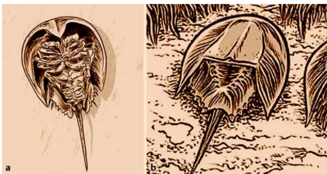
Abb. 4 a, b Darstellung von Pfeilschwanzkrebsen in der Kunst: Aus dem Zyklus „MIKROMakro“ von Jens Harder, Berlin, e. o. plauen Förderpreisträger 2007.

physiologisches Modell für menschliche Sehvorgänge und Augenerkrankungen (K. Hartline, Nobelpreis für Medizin 1967) [8]. Die archaisch-exotische Form der Tiere ist auch Gegenstand der Kunst (▶ Abb. 4 a, b ).