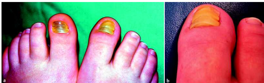
Abb. 1 a, b Symmetrische beidseitige isolierte Dystrophie der Großzehen bei einer 16-jährigen Patientin mit begleitender Paronychie und ungewöhnlicher Morphologie, die an drei hintereinander angeordnete Rückenpanzer von Pfeilschwanzkrebsen erinnert. Aufsicht von oben (a) und von proximal (b).