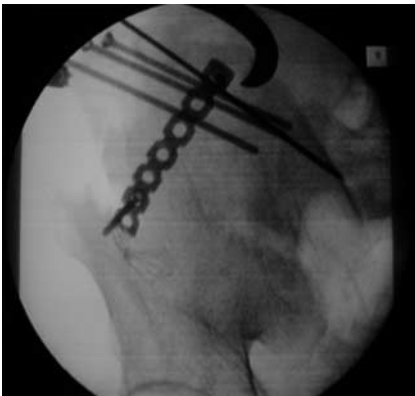
Abb. 11 Weiteres Röntgenbeispiel.