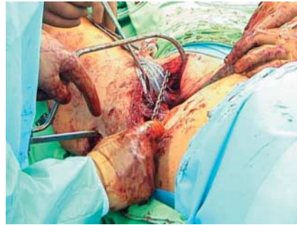
Abb. 9 Die Zange erlaubt auch spezielle schiebende Repositionsmanöver, z.B. vom Schambeinast zur äußeren Beckenschaufel.