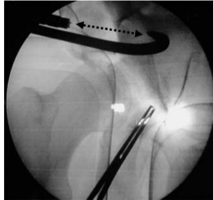
Abb. 6 Röntgenbild, welches das Einhaken und die Schieberichtung anzeigt.