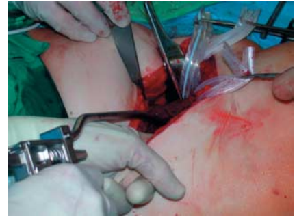
Abb. 10 Die Gegenspitze kann vorsichtig mit dem Finger eingeführt werden.