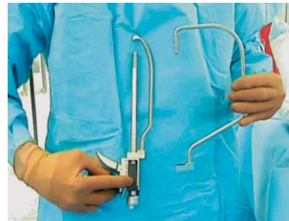
Abb. 3 Es sind verschiedene schlanke und ausladende Bügel verfügbar.