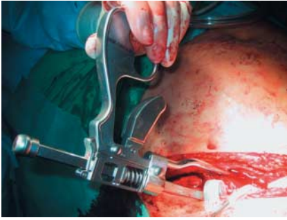
Abb. 5 Einsatz der Zange durch einen inguinalen Zugang.