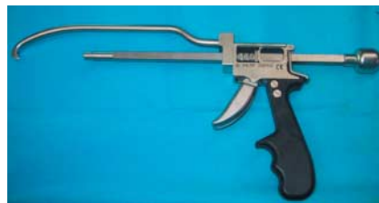
Abb. 1 Die koaxiale Zange mit dem schlanken Bügel.

In allen Testkliniken und bei allen Chirurgen, welche die Zange ausprobieren konnten, war der Mechanismus bei jedem Einsatz einfach und selbsterklärend angesehen worden. Die Zange war in jedem Fall sehr hilfreich. Damit sind Repositionsmanöver möglich, die bisher so nicht oder nur sehr schwer durchgeführt werden konnten.