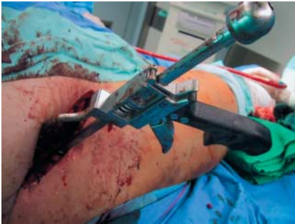
Abb. 8 Weiteres Beispiel einer Zangenposition durch inguinalen Zugang.