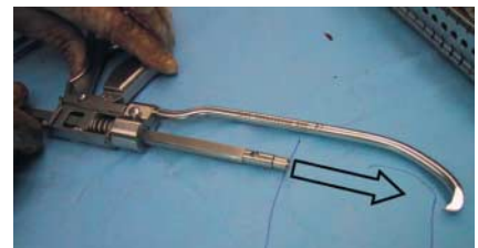
Abb. 2 Der Pfeil zeigt die Schieberichtung an.