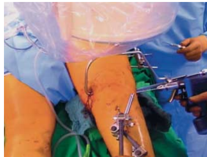
Abb. 12 Koaxiale Zange mit großem Bügel zur streng queren reponierenden Kompression im Bereich der Oberschenkelkondyle.