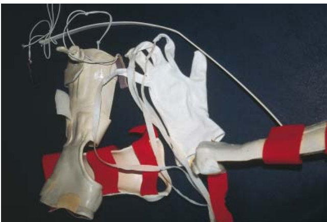
Abb. 6a Beugehandschuh, Streck- und Beugequengel.

Neben funktionellen Übungen mit therapeutischer Knetmasse, Handgelenks-