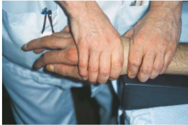
Abb. 2 Mobilisation der Handwurzel nach palmar für die Dorsalextension.

Für einen koordinierten Fingereinsatz ist eine aktive Widerlagerung im Handgelenk nötig. Das bedeutet, dass das Handgelenk in Dorsalextension aktiv muskulär stabilisiert wird, um eine physiologische, kombinierte Fingerflexion zu schulen.