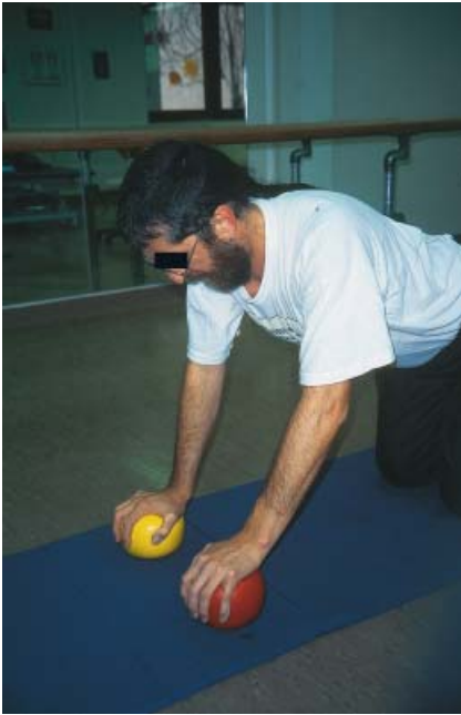
Abb. 4 Handstütz im Vierfüßlerstand mit Ball wegen eingeschränkter Dorsalextension.

Sind die bisherigen Bemühungen ohne signifikanten Fortschritt geblieben oder hat sich das Vollbild einer Algodystrophie entwickelt, ergibt sich gelegentlich die Notwendigkeit, das Rehabilitationsprogramm unter stationären Bedingungen fortzusetzen.