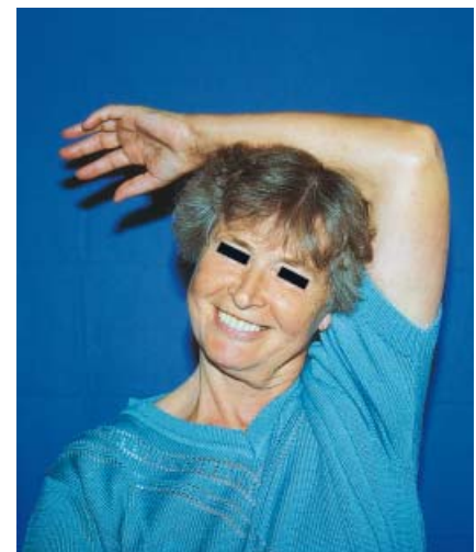
Abb.1 Resorptionsförderung durch Lagerung.

Die Dystrophieprophylaxe ist von entscheidender Bedeutung. Im Vordergrund der therapeutischen Bemühungen stehen Schmerzlinderung und Entstauung bei postoperativem oder posttraumatischem Ödem. Dazu setzt die Physiotherapie verschiedene Maßnahmen ein. Die Anleitung des Patienten sollte praktisch durchgeführt werden. Die Lagerung spielt eine wichtige Rolle bei der Resorptionsverbesserung. Der Patient muss darauf achten, dass die Hand über dem Ellenbogen, der Ellenbogen über dem Schultergelenk gehalten wird. Es entsteht ein Gefälle, so dass Schwellung leichter resorbiert werden kann (z.B. Hochlagern mit Ablegen des Unterarmgewichtes auf dem Kopf). Unterstützen kann der Patient die Entstauung mit der aktiven Muskelpumpe. Beim Fingerspreizen und Fingerschließen wird die Handinnenmuskulatur kontrahiert, beim Handschließen und Handöffnen wird die Muskelpumpe am Unterarm aktiviert. Die Blutzirkulation wird durch die Muskelaktivität erhöht und die Resorption der Schwellung unterstützt ( Abb.1 ).