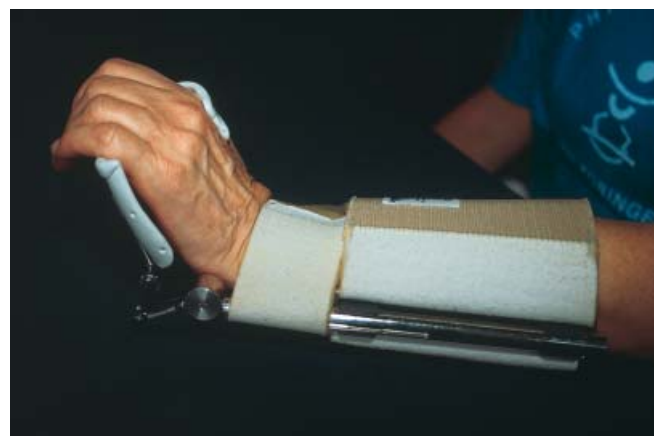
Abb. 6b Quengelschiene für Dorsalextension.