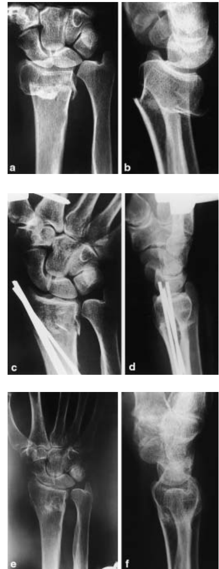
Abb. 1 Extraartikuläre Fraktur des Radius, impaktiert mit axialer Verkürzung ( a, b ). Osteosynthese mit Kirschner-Drähten und Fixateur ( c, d ). Ausheilungsbilder 1 Jahr nach Unfall ( e, f ).

Duming [9] konnte experimentell nachweisen, dass eine alleinige Fixateur-externe-Ruhigstellung immer noch eine Bewegung der Fragmente ermöglichte. Wurden zusätzlich Kirschner-Drähte eingebracht, entsprach die Stabilität der der Plattenfixation. Ähnliche Ergebnisse zeigte Wolfe [35]. Die Kirschner-Draht-Fixierung führte zu einer deutlichen Verminderung der Bewegung des distalen Radiusfragmentes bei Beugung/Streckung, Radial- und Ulnarabduktion und Rotation.