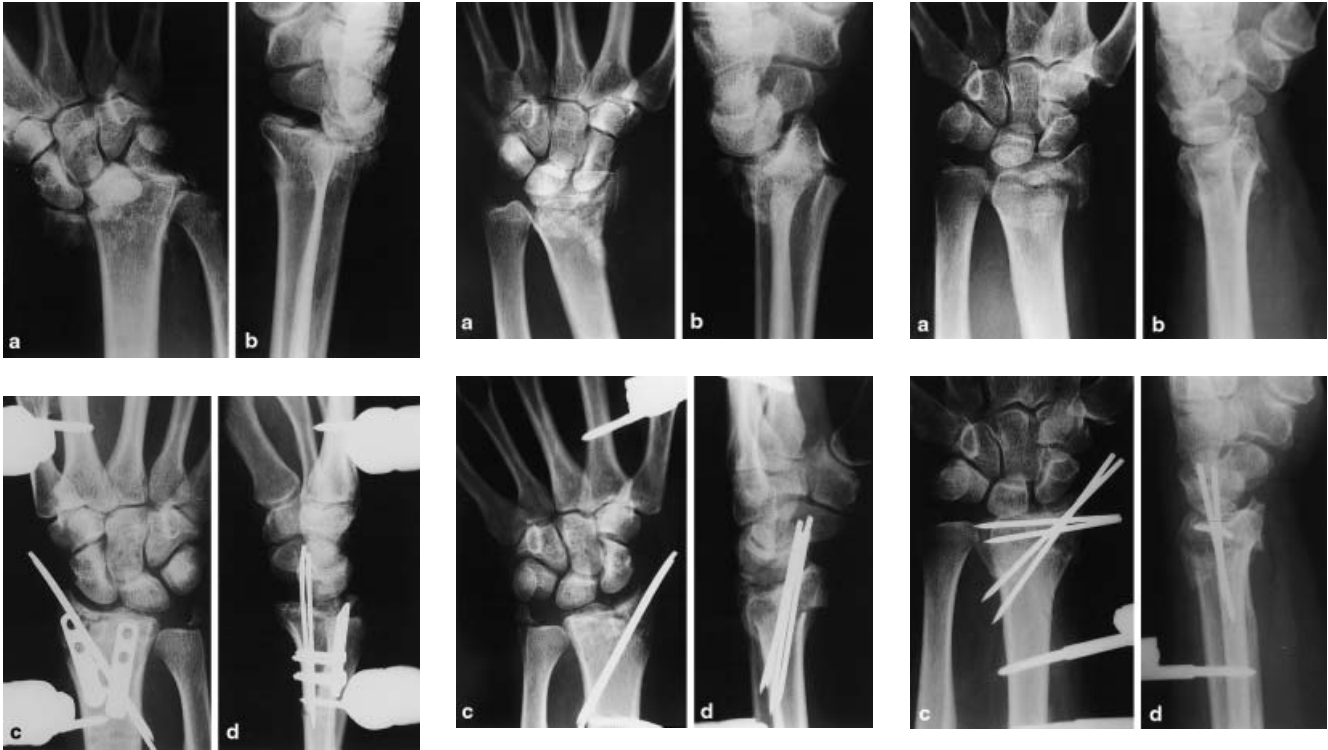
Abb. 3 C 3-Fraktur (a, b) Anlage eines Fixateur externe. Die dorsalen Fragmente wurden mit 2 Platten und dorsal nur als Abstützung fixiert.

Die Indikation zum Verfahrenswechsel [21] besteht unter folgenden Bedingungen