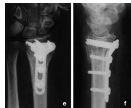
Abb. 5 C 2-Fraktur (a, b), primäre Stabilisierung mit Kirschner-Drähten und Fixateur (c, d), Inkongruenz im Radioulnargelenk. Sekundäre Plattenosteosynthese von volar (e, f).