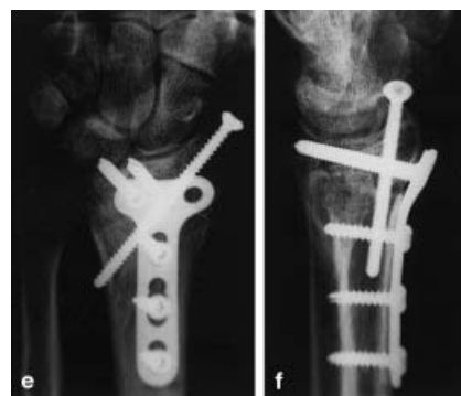
Abb. 4 C 3-Fraktur (a, b), primäre Osteosynthese mit Fixateur und Kirschner-Drähten (c, d). Verfahrenswechsel und Stabilisierung mit winkelstabiler Platte von volar und zusätzlicher Zugschraube zur Stabilisierung des Proc. styloideus radii (e, f).