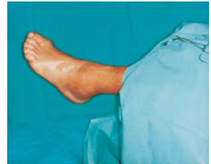
Abb. 4 Der Beinhalter ersetzt eine Pflegekraft bis zur Teilabdeckung.