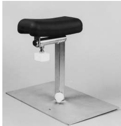
Abb. 1 Beinhalter für die präoperative Vorbereitung.

Wir haben ein Hilfsmittel entwickelt, welches bei Operationen am Fuß und distalen Unterschenkel bis zur Unterschenkelmitte das Halten des Beines durch eine Schwester oder einen Pfleger während der OP-Vorbereitung entbehrlich macht.