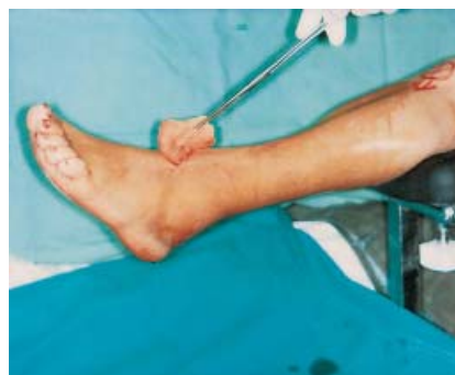
Abb. 3 Beinhalter im Einsatz zur präoperativen Desinfektion des OP-Gebietes am Fuß bis mittleren Unterschenkel.