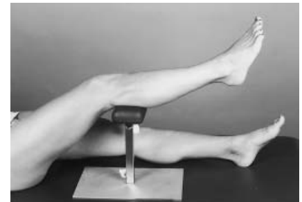
Abb. 5 Der Beinhalter kann zur Unterstützung bei Eingriffen an der Unterschenkelrückseite oder an der Ferse eingesetzt werden.

In Zusammenarbeit mit einer Fa. für Lagerungsartikel* entwickelten wir eine Stütze, welche unseres Erachtens diesen Zweck erfüllt. Unser Ziel war es, ein einfach zu handhabendes Gerät zu konstruieren, das möglichst kostengünstig gefertigt werden kann. Für die Konstrukteure bedeutete dies, überwiegend Teile aus der Serienproduktion zu benutzen.