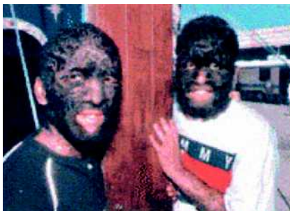
Abb. 5 Zwei männliche Mitglieder einer mexikanischen Großfamilie mit vollständiger Gesichtsbehaarung, sie treten als „Wolf Boys“ in einem Zirkus auf.

In Mexiko lebt in unserer Zeit eine Großfamilie, von der rund 10 Mitglieder im Gesicht und am Körper völlig behaart sind; einige dieser Menschen arbeiten in einem Zirkus (● Abb. 5 ). Im Verlauf von 5 Generationen waren etwa 20 Mitglieder (Männer und Frauen) dieser Großfamilie von der völligen Behaarung im Gesicht und am Körper betroffen. Vermutlich befindet sich das bei ihnen aktivierte „Werwolf-Gen“ auf dem X-Chromosom, denn bei völlig behaarten Müttern und normalen Vätern beträgt die Wahrscheinlichkeit für die Nachkommen, selbst völlig behaart zu sein, 50 Prozent. Ist dagegen der Vater völlig behaart, sind bei einer normalen Mutter alle seine Töchter völlig behaart und keiner seiner Söhne. Ein Arzt der Großfamilie sammelt zwar Blutproben, Befunde über genetische Analysen liegen allerdings bisher nicht vor. Gegen die X-Chromosom-These als Ort des aktivierten „Werwolf-Gens“ sprechen jedoch Beobachtungen bei der Familie von Petrus Gonsalvus. Bei einer normalen Mutter war einer seiner Söhne wie er selbst völlig behaart. Die Position des „Werwolf-Gens“ ist somit noch nicht identifiziert und nur durch seine Aktivität kann auf seine Existenz geschlossen werden.