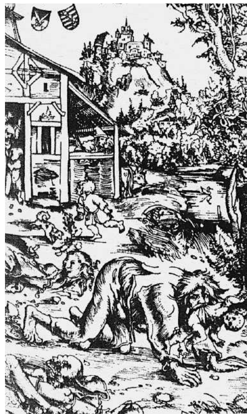
Abb. 1 Ein Werwolf raubt ein Kind, Holzschnitt von Lukas Cranach der Ältere, 1512. Der Werwolf hat noch das Aussehen und die Gestalt eines Menschen, läuft allerdings bereits auf allen Vieren.

▼ Bereits die Menschen der Steinzeit schätzten Mischwesen zwischen Menschen und Tieren. Für die Mitglieder der frühen Jäger- und Sammler-Kulturen war der Jagderfolg überlebenswichtig, denn allein er garantierte eine ausreichende Fleischversorgung. Viele Jäger nahmen sich deshalb für eine erfolgreiche Jagd die großen Raubtiere zum Vorbild. Beliebte waren Wölfe, die geschickt in Rudeln jagten und von denen die Menschen manche Jagdtechniken kopieren konnten. Auf uralten Höhlenmalereien lassen sich immer wieder Mischwesen aus Raubtieren und Menschen nachweisen, die bei rituellen Treffen von den Jägern beschworen wurden, um die eigenen Jagderfolge zu verbessern. In der menschlichen Fantasiewelt gab es schon früh zwischen Men-