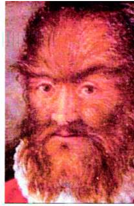
Abb. 3 Petrus Gonsalvus nach einem Gemälde der Kunstkammer von Schloß Ambras bei Innsbruck, um 1580, Künstler unbekannt.

schendes Ergebnis auf. Das Hühnergewebe mit den Mäuseanlangen produziert plötzlich Zähne, die allerdings keine Mäusezähne sind. „Hühnerzähne“ sind in der Natur überhaupt nicht vorgesehen, denn alle Vögel der Gegenwart besitzen keine Zähne. „Hühnerzähne“ lassen sich nur über eine Evolution erklären, denn Archaeopteryx, der vermutliche Urahn aller Vögel, besaß vor etwa 60 Millionen Jahren tatsächlich Zähne, was aus fossilen Funden belegt werden kann. Vögel der Gegenwart verfügen somit noch über das genetische Potenzial zur Zahnbildung, und es scheint, dass ihnen allein das Entwicklungssignal zur Zahnbildung verloren gegangen ist. Es ist schon erstaunlich: Obwohl sich die Entwicklungswege zu den Säugetieren und zu den Vögeln bereits vor rund 300 Millionen Jahren getrennt haben, wirken Entwicklungssignale von Säugetieren immer noch bei Vögeln [2].