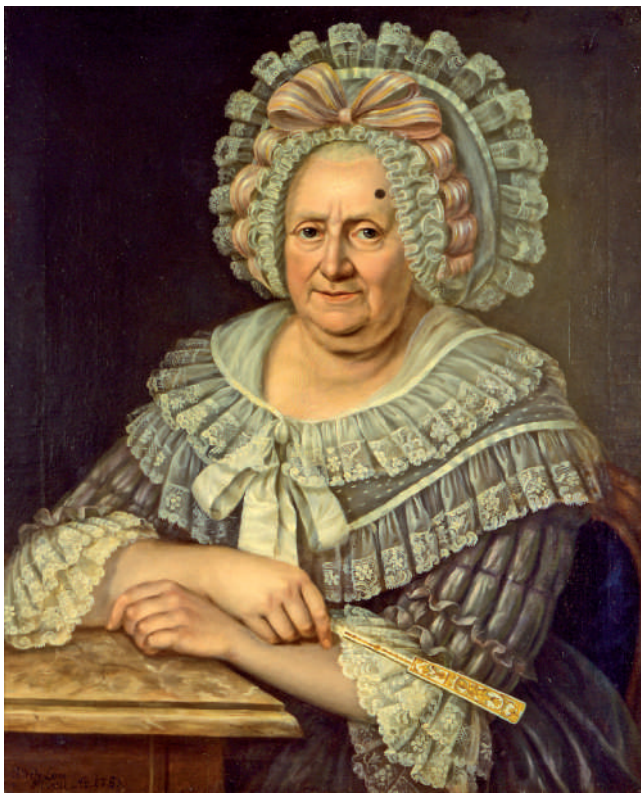
Abb. 1 Porträt von Josepha Gobin (1718 – 1806) aus dem Jahre 1789, gemalt in Öl auf Leinwand von Johann Jacob de Lose (1755 – 1813). Beachte die Lentigo maligna an der Stirne links.