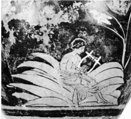
Abb. 3 Apollon und weiße Krähe, Skyphos (um 450 v. Chr.) Palermo. Nach Schefold, 209, Abb. 284.