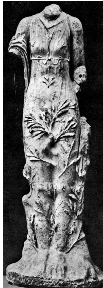
Abb. 5 Daphne, in Lorbeer verwandelt, Statue augusteischer Zeit? Nach hellenistischem Original? Früher Sammlung Borghese. Nach Schefold, 208, Abb. 283.

2. Die schöne Daphne , verfolgt vom liebeskranken Apollon, flieht vor ihm „schneller als der leichte Lufthauch“ (Ovid, Metamorphosen 1,502 f.) und entzieht sich ihm am Ende ganz, indem sie sich in einen Lorbeerbaum verwandelt (☉ Abb. 5 ).