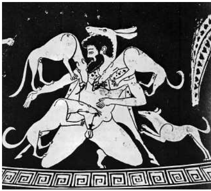
Abb. 2 Aktaion, in einen Hirsch verwandelt, Amphora des Eucharides-Malers, (nach 490 v. Chr.) Hamburg, Inv.-Nr. 1966.34. Nach Schefold, 138, Abb. 180.