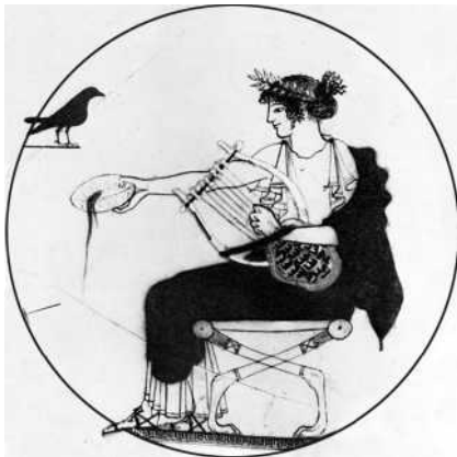
Abb. 4 Apollon mit Lorbeerkranz und Raben, weißgrundige Schale (um 490 v. Chr.) Delphi. Nach Schefold, 209, Abb. 285.

fen ist. Koronis , von Apollon schwanger, gibt sich danach auch noch einem Sterblichen hin. Flugs bringt eine weiße Krähe dem Gott die fatale Botschaft. Wie so oft trifft die Strafe den Überbringer der schlechten Nachricht; darauf wird sein weißes Gefieder rabenschwarz, was sich bekanntlich seit dieser Zeit nicht geändert hat (☉ Abb. 3 , ☉ Abb. 4 )!