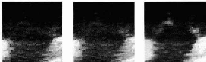
(E) Mittelwert Filter