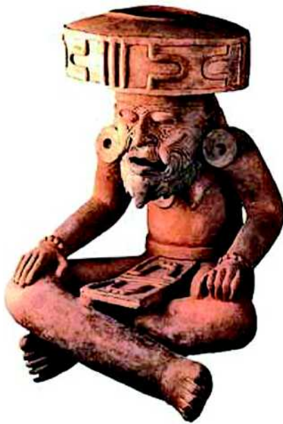
Abb. 6 Keramik von Huehueotl, der Feuergott der Azteken. Es ist ein alter Mann mit einem Bart dargestellt, obwohl es Bartwuchs bei Indianern nicht gibt.