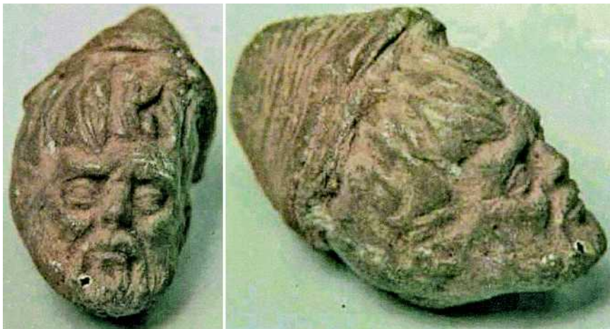
Abb. 5 Vorder- und Seitenansicht des römischen Kopfes von Calixtlahuaca, gefunden in einem intakten Aztekengrab aus der Zeit vor der Ankunft der Spanier (National-Museum für Anthropologie, Mexico-City, Mexiko).

Der französische Forscher Jacques de Mahieu formulierte schließlich die umstrittene These, dass auch die Wikinger in Südamerika gewesen waren. Von ihren nordamerikanischen Siedlungen aus wären sie zunächst zur Halbinsel Yucatan und