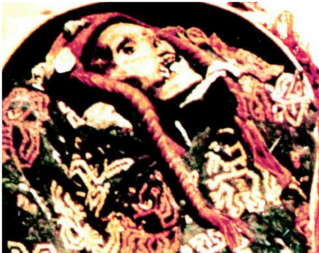
Abb. 7 Perücke aus naturblonden menschlichen Haaren auf einer Mumie der Inka-Zeit, gefunden in Paracas/Peru (National-Museum für Anthropologie, Lima, Peru).