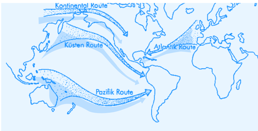
Abb. 1 Mögliche Routen zur Erstbesiedlung von Amerika. Die ersten Einwanderer kamen vermutlich mit Schiffen und nicht über Land.