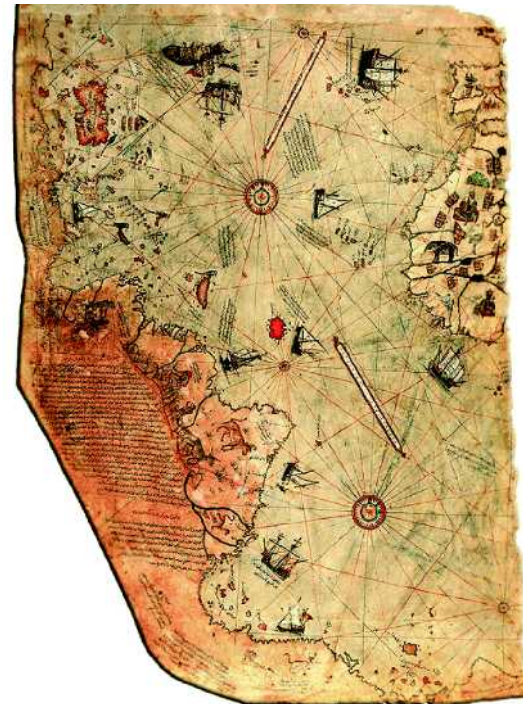
Abb. 4 Karte des Piri Reis, gezeichnet um 1513. Die Küste von Südamerika ist abgebildet. Die Quellen der Karte sollen bis in die Antike zurückgehen (Nationalbibliothek Ankara, Türkei).

Während der Antike wurden die Küsten von Südamerika vermutlich sogar kartografiert. Die heute rätselhafte Karte des osmanischen Admirals Piri Reis wurde um 1513 gezeichnet (● Abb. 4 ) und zeigt deutlich die Küstenlinie von Südamerika