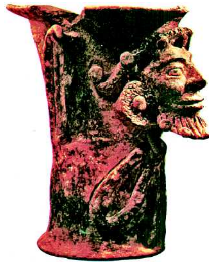
Abb. 3 Altamerikanisches Räuchergefäß aus der Zeit vor Kolumbus, gefunden in Iximche (Guatemala). Der Kopf mit Bart weist auf phönizische Gesichtszüge hin (Musée de l'homme, Paris).

Pharaos waren sie sogar einmal um Afrika herumgesegelt. Den Atlantik betrachteten sie als ihr Meer und ließen keine fremde Kaufleute die Straße von Gibraltar passieren.