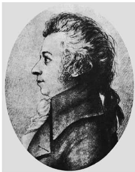
Abb. 1 Wolfgang Amadé Mozart im Alter von 33 Jahren. Silberstiftzeichnung von Johanna Dorothea Stock (1760–1832), entstanden in Dresden am 16. oder 17. April 1789 (im Besitz der Internationalen Stiftung Mozarteum, Salzburg).

Pocken dauerhafte Narben in Wolfgangs Gesicht, während seine Schwester Nannerl, die sich kurz darauf ebenfalls ansteckte, ohne solche bleibenden Spuren davonkam [4, 12, 14].