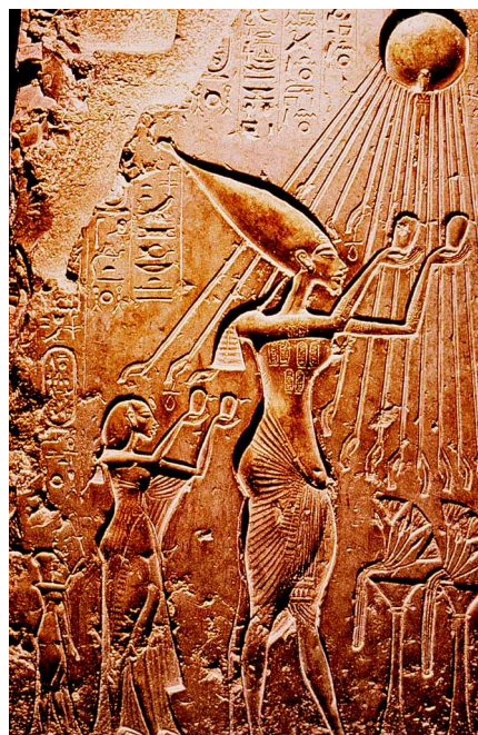
Abb. 1 Amarna-Kultur in Ägypten (1364–1348 v. Chr.). Menschen und Pflanzen empfangen die Leben spendenden Sonnenstrahlen und der Priester-König Echnaton huldigt dem allein herrschenden Sonnengott Aton.

Die Sonne wird denn auch im Mittelalter wiederholt in den Dienst der Lobpreisung Gottes gestellt. Franziskus von Assisi, der Gründer des Franziskaner-Ordens, besingt 1224 in seinem Sonnengesang ( Cantico di Frate Sole ) den Bruder Sonne und die Schwester Mond und beschwört beide, ihn in der Lobpreisung Gottes zu unterstützen. Ähnliches hat der Dominikaner-Mönch Tommaso Campanella 1602 ausgedrückt, als er im Gefängnis seinen utopischen Roman „ Città del Sole “ schrieb und einen idealisierten Sonnenstaat beschrieb.