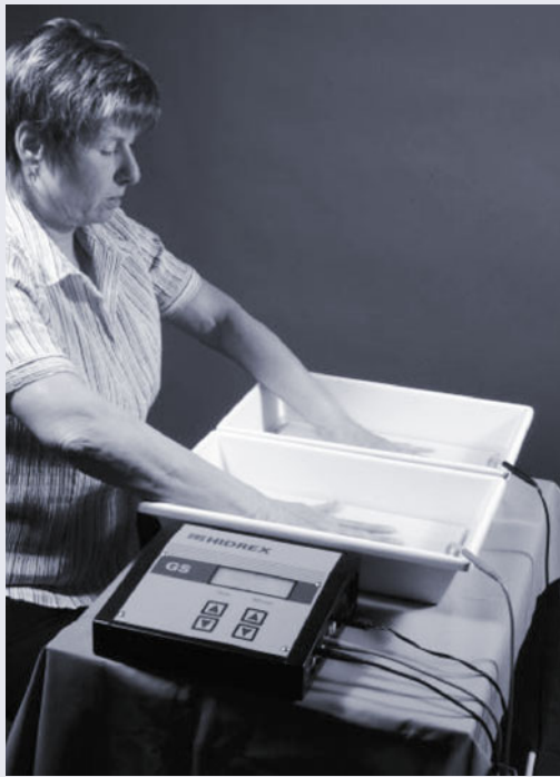
Abb. 3 Leitungswasser-Iontophorese

nahmen können sich diese Präparate (z.B. Sweatosan „N“, 3 x 2 Kps./d) dennoch nützlich erweisen.