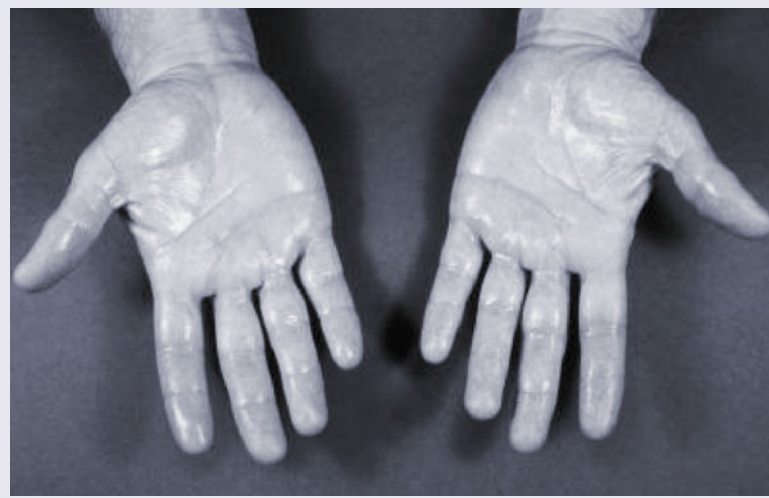
Abb. 1 Hyperhidrosis palmaris Grad III

Die Hyperhidrosis palmoplantaris und die Hyperhidrosis axillaris werden in drei Schweregrade eingeteilt. Für die Hyperhidrosis palmoplantaris bezieht sich Grad I auf eine Anfeuchtung der Hand- und Fußflächen. Grad II bedeutet die Bildung von Schweißperlen, jedoch beschränkt sich das Schwitzen streng auf Palmae und Plantae. Bei einer starken Hyperhidrose Grad III bilden sich Schweißperlen auch an den distalen dorsalen Flächen von Fingern, Zehen und am seitlichen Fußrand sowie ein Abtropfen des Schweißes.