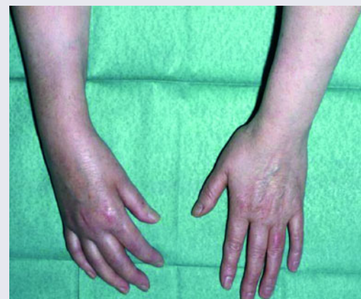
Abb. 1 Komplexes regionales Schmerzsyndrom der rechten Hand

Deutlich zu erkennen ist die distale Generalisierung der Symptomatik mit ödematöser Schwellung und livider Verfärbung als Zeichen der autonomen Dysfunktion