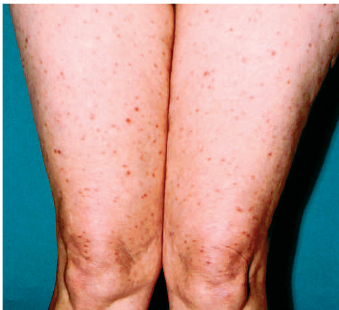
Abb. 1 Hautbefund bei Urticaria pigmentosa.

Probepbiopsie Abdomen: In der retikulären Dermis fand sich ein diskretes, perivaskulär akzentuiertes Rundzellularinfiltrat mit diffus eingestreuten Mastzellen (Abb. 2). Einzelne Mastzellen ließen sich auch zwischen den Kollagenfaserbündeln der tieferen Dermis nachweisen.