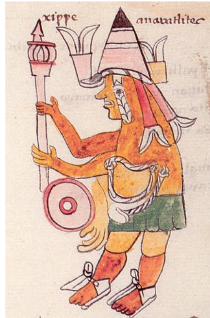
Abb. 2 Bild des Gottes Xipe Totec aus den „Primeros Memoriales“ des Bernardino de Sahagún [5]. Zwischen dem Schild mit roten Kreisen und dem grünen Rock des Gottes sieht man die herabhängende „Haut“ des Opfers.

... seine Yopi-Krone 3 mit den gespreizten Bändern hat er aufgesetzt. Eine Menschenhaut, die Haut eines Gefangenen hat er angezogen. Er trägt eine Perücke aus lockeren Federn. Er hat goldene Ohrscheiben. Er hat einen Tzapote-Rock 3 , Er hat Schellen. Sein Schild hat rote Kreise. Den Rasselstab hält er aufrecht in der Hand [4].