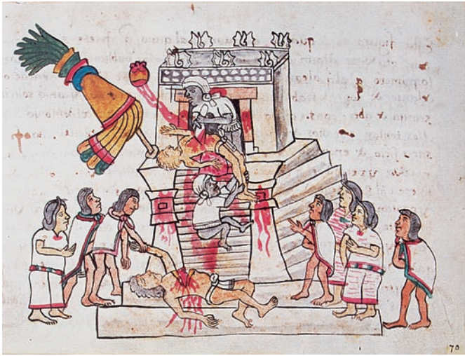
Abb. 3 „Herzopfer“ aus dem „Libro de la Vida“ [11]. Vor dem Eingang zum Tempel liegt ein Mensch, dem der Priester mit einem Steinmesser das Herz aus der Brust geschnitten hat. Es „schwebt“ in der Luft über dem Kopf des Opfers. Die Stufen zum Tempel sind blutbeschmiert, am Fuß des Tempels liegt ein zweites, totes Opfer.

zehr an die Mitglieder der Gemeinde 4 . Die abgezogenen Häute aber legten sich Männer um, die der Gott mit Hautulzera, Krätze, eiternden Augen, Wucherungen der Hornhaut und anderen Leiden geschlagen hatte. Sie eilten durch die Straßen der Stadt, triefend von Fett und besudelt mit Blut. Den Häuten der dem Gott Geopfer-ten wurde gewissermaßen eine Emanationswirkung und Heilkraft zugesprochen. Betrunkene, Possenreißer und alle, die richtige Männer sein wollten, folgten ihnen. Frauen dagegen, die mit gleichen Leiden behaftet waren, brachten dem Gott ein Opfer an seinem Festtag. Legten Priester und Kranke die übergestreifte Haut ab, kam darunter der „neue Mensch“ zum Vorschein. Opfer und Tod hatten dann zu neuem Leben geführt. Diese Auffassung, dass es ohne Tod kein neues Leben geben könne, spiegelt sich deutlich auch im Bilde der sich häutenden Schlange, die den Azteken als Symbol der Wiedergeburt, der Fruchtbarkeit und des Überflusses galt. Ob aus diesen Vorstellungen die Assoziation des Gottes Xipe Totec mit der „Gefiederten Schlange“ (Quetzalcóatl) hervorgegangen ist, ist unklar [8].