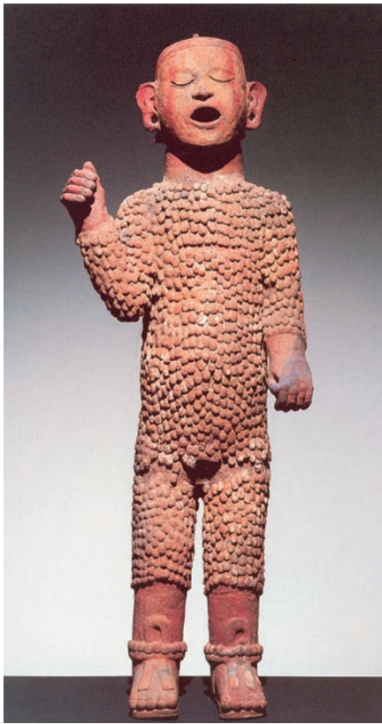
Abb. 1 Tonfigur des Gottes Xipe Totec. Der Gott ist mit der abgezogenen Haut eines Opfers bekleidet, deren Struktur durch die „Schuppung“ deutlich wird. Besonders an Armen und Beinen erkennt man die „zweite Haut“ aufgrund der Schnittränder 2 .