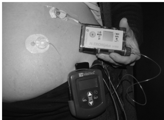
Abb. 2 Schwangere im 3. Trimenon mit Insulinpumpe und kontinuierlicher Glukosemessung.

Zum Schutz vor Hypoglykämie-Problemen kann nach der Konzeption der in den ersten Schwangerschaftswochen um etwa 10% verminderte Insulinbedarf leicht durch eine verminderte Basalrate aufgefangen werden. Ab der 6. bis 7. Gestationswoche ergibt sich durch das Ansteigen der Serumspiegel für das Humane Plazenta-Lactogen (HPL) sowie der ebenfalls insulinantagonistischen Hormone Östriol, Prolaktin und STH eine zunehmende Insulinresistenz. Dies führt dazu, dass der mütterliche Insulinbedarf insbesondere in der zweiten Schwangerschaftshälfte kontinuierlich ansteigt. Verglichen mit dem präkonzeptionellen Insulinverbrauch kann es zu einer Zunahme des maximalen Insulinbedarfs von mehr als 100% kommen. Nach der 36. SSW kann der Insulinbedarf