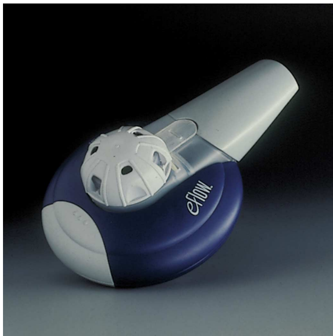
Abb. 3 e-Flow™ (mit freundlicher Genehmigung der Fa. PARI, GmbH, Starnberg, Deutschland).

LC PLUS 985 \pm 952 \mu\text{g/g} ). Im Vergleich zum PARI LC PLUS konnte jedoch mit dem AeroDose 5.5 RP die gleiche Tobramycin-Sputumkonzentration mit einem Drittel der Dosis und in weniger als der Hälfte der Zeit erreicht werden. Eine frühere vergleichende szintigraphische Depositionsstudie [28] hatte bei neun gesunden Probanden für den AeroDose-Vernebler im Vergleich zum PARI LC PLUS eine signifikant höhere Lungendeposition (35% vs. 9,1%), eine geringere Restmenge im System (15% vs. 43%) und geringere Verluste während der Exhalation (16% vs. 28%) ergeben. Problematisch bleibt die extrem hohe Variabilität der beobachteten maximalen Tobramycin-Sputumkonzentration. Weiter kann auf einem Mukusplaque im zentralen Bronchialsystem eine hohe lokale Konzentration des Antibiotikums durch Impaktion erreicht werden, ohne dass deshalb anhand der Sputumkonzentration auf die Gesamtlungendeposition geschlossen werden darf.