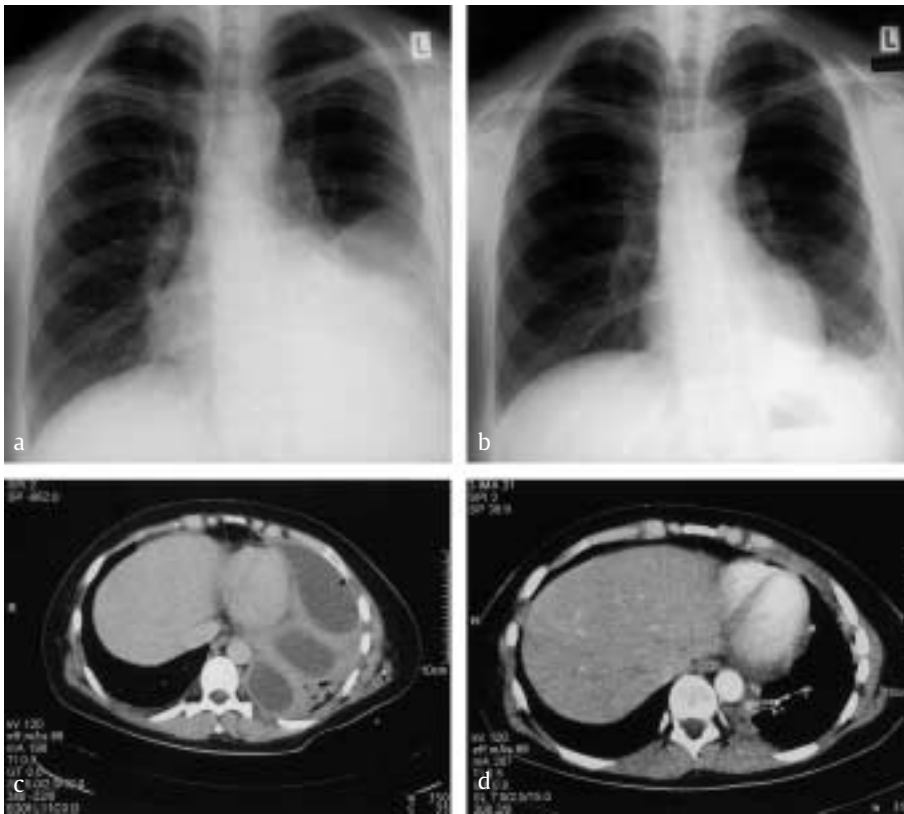
Abb. 1 Gekammertes Pleuraempyem im konventionellen Röntgen (Abb. 1a u. b) und im CT (Abb. 1c u. d) des Thorax vor Beginn der Behandlung und nach lokaler fibrinolytischer Therapie mit Urokinase ( 2 \times 100\,000 IE/d) über 10 Tage.

86,5 versus 25% in der Placebogruppe feststellen. Darüber hinaus fanden sich auch Vorteile bei den klinischen Parametern Zeit zur Entfieberung und Dauer der Hospitalisierung in der mit Urokinase behandelten Gruppe. Ähnliche Ergebnisse anhand klinischer Endpunkte demonstrierte eine türkische Untersuchung an 49 Patienten, hier konnte als weiterer Unterschied eine signifikant niedrigere chirurgische Dekortikationsrate in der Urokinasegruppe gezeigt werden [48].