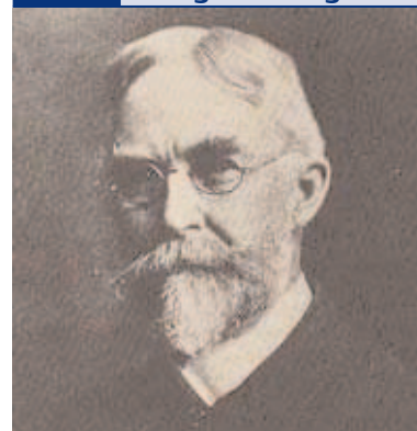
Abb. 1 George Huntington

Beschrieb als Erster die Chorea major als erbliche Nervenerkrankung.