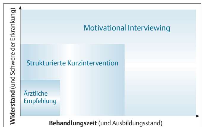
Abb. 2 Differenzialindikation verschiedener suchtmmedizinischer Interventionen bezüglich des Widerstandsniveaus des Patienten beziehungsweise der Schwere der Abhängigkeitserkrankung.

Trotz ihrer nachgewiesenen Wirksamkeit sind suchtmmedizinische Kurzinterventionen [z. B. 13, 16, 29] allein in der Regel keine ausreichende Behandlungsmaßnahme. So ist anlässlich der Intervention nach Möglichkeit weiterführende suchtmmedizinische Behandlung anzubieten. Allein das Angebot, bei einem Folgetermin auf das angesprochene Problemfeld gegebenenfalls