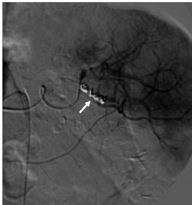
Abb. 1 DSA-Therapie bei dem im konkreten Fall geschilderten Patienten mit Haemosuccus pancreaticus. Zustand nach Absetzen von mehreren Coils in einem Ast der A. lienalis (Pfeil). Während die die Milz versorgenden großen lienalen Gefäße weiterhin regelrecht durchströmt sind, ist der Gefäßast, der die arrodiierten Gefäße zur Pankreasschwanz-Pseudozyste speist, komplett verschlossen. Die Pankreasschwanz-Pseudozyste wird durch das Kontrastmittel nicht mehr angefärbt.

Mikrosphären sind Albumin- oder Stärketeilchen mit einer Größe zwischen 15–50 µm. Diese Teilchen sind biologisch abbaubar und haben eine Halbwertszeit von wenigen Minuten bis mehreren Tagen. Diese kurze Auflösungszeit macht den Einsatz bei Blutungen nur wenig erfolgversprechend.