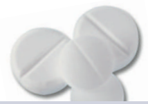
Tab. 3 Wichtige Arzneimittelinteraktionen mit antiinfektiös wirksamen Medikamenten