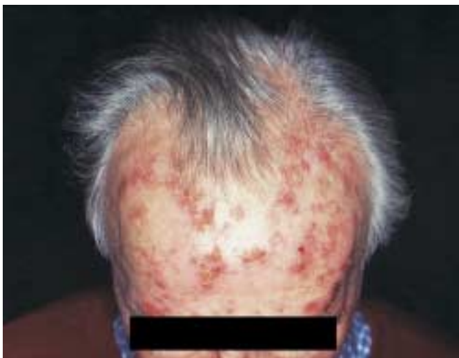
Abb. 1b Aktinische Keratose vor Therapie.