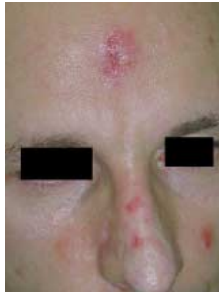
Abb. 2 Weitgehend unveränderter Hautbefund, wenige Wochen vor Beginn einer Psychotherapie im Frühjahr 2001.