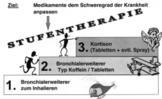
Abb. 2 Medikamente – wofür?