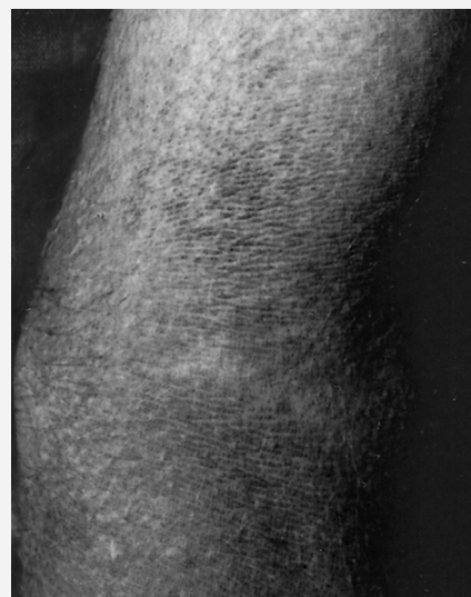
Abb. 1 Hautbefund 3 Monate nach Nierentransplantation: schmutzig-bräunliche Hyperpigmentierung in der Ellenbeuge.

12 Jahre alter Junge in gutem Allgemein- und Ernährungszustand, Gewicht 41 kg (P 25), Länge 156 cm (P 25). Internistischer Untersuchungsbefund unauffällig bis auf leichte Hypertrichose und reizlose Narbe nach Nierentransplantation im rechten Unterbauch. Bräunliche, unscharf begrenzte, leicht erhabene Hautveränderungen im Bereich der Armbeugen, des Halses sowie periumbilikal (Abb. 1). Kein Juckreiz und keine Kratzspuren. Keine Lymphadenopathie.