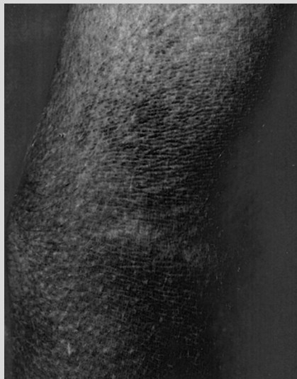
Abb. 1 Hautbefund 3 Monate nach Nierentransplantation: schmutzig-bräunliche Hyperpigmentierung in der Ellenbeuge.

12 Jahre alter Junge in gutem Allgemein- und Ernährungszustand, Gewicht 41 kg (P 25), Länge 156 cm (P 25). Internistischer Untersuchungsbefund unauffällig bis auf leichte Hypertrichose und reizlose Narbe nach Nierentransplantation im rechten Unterbauch. Bräunliche, unscharf begrenzte, leicht erhabene Hautveränderungen im Bereich der Armbeugen, des Halses sowie periumbilikal (Abb. 1). Kein Juckreiz und keine Kratzspuren. Keine Lymphadenopathie.