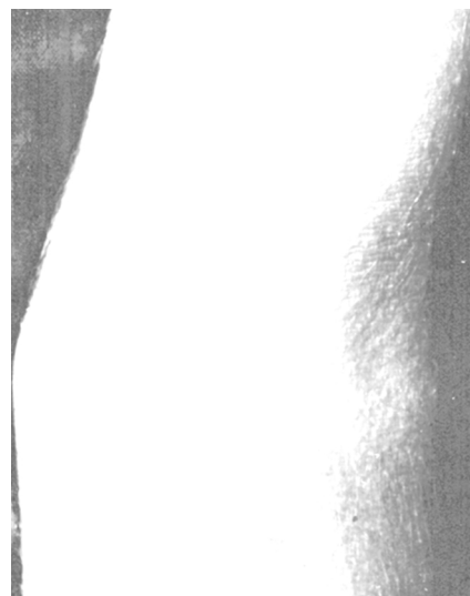
Abb. 1 Hautbefund 3 Monate nach Nierentransplantation: schmutzig-bräunliche Hyperpigmentierung in der Ellenbeuge.

12 Jahre alter Junge in gutem Allgemein- und Ernährungszustand, Gewicht 41 kg (P 25), Länge 156 cm (P 25). Internistischer Untersuchungsbefund unauffällig bis auf leichte Hypertrichose und reizlose Narbe nach Nierentransplantation im rechten Unterbauch. Bräunliche, unscharf begrenzte, leicht erhabene Hautveränderungen im Bereich der Armbeugen, des Halses sowie periumbilikal (Abb. 1). Kein Juckreiz und keine Kratzspuren. Keine Lymphadenopathie.