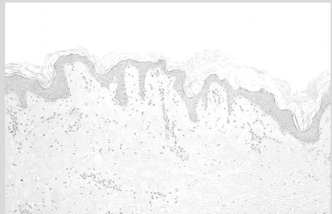
Abb. 2 Histologischer Befund: Epidermale Papillomatose mit milder Acanthose sowie Orthohyperkeratose.

Im Rahmen einer Nephrektomie der Eigennieren konnte in Narkose eine Biopsie der Hautläsionen aus der Nähe der Transplantatnarbe entnommen werden, mit der die Verdachtsdiagnose einer Pseudo-Acanthosis nigricans bestätigt werden konnte (Abb. 2).