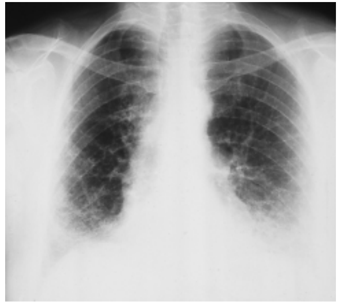
Abb. 2 Fibrosierende Alveolitis mit schwerer restriktiver Ventilationsstörung bei einer Patientin mit Mikroskopischer Polyangiitis. Weitere Vaskulitismanifestationen: pauci-immune nekrotisierende Glomerulonephritis, sensomotorische Polyneuropathie, migratorische Arthralgien/Arthritiden, MPO-ANCA.

3. Fibrosierende Alveolitis (FA): FA mit einer diffusen, in kranio-kaudaler Richtung zunehmenden retikulären Infiltration mit oder ohne Honigwabemuster werden bei weniger als 10% der MPA-Patienten beobachtet, in Einzelfällen kann es sich dabei um das Erstsymptom der MPA handeln (Abb. 2) [37, 44]. Dieses Schädigungsmuster unterscheidet die MPA von der WG und vom CSS. Fibrotische Veränderungen bei der WG manifestieren sich in unregelmäßig angeordneten Bindegewebszügen, ein Honigwabemuster gehört nicht zum Spektrum der WG-assoziierten Veränderungen [25, 26]. Die Pathogenese der FA bei der MPA ist unklar, ein ursächlicher Zusammenhang mit stattgehabten alveolären Blutungen wird diskutiert [45]. Es ist nicht geklärt, ob die FA bei der MPA einer immunsuppressiven Therapie zugänglich ist.