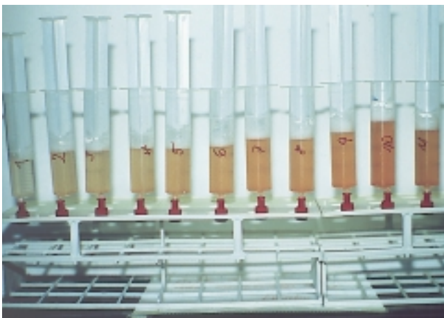
Abb. 3 Diffuse alveoläre Hämorrhagie: progredient blutige Spülflüssigkeit bei fraktionierter BAL.

Bronchoskopisch werden die Zeichen einer multisegmentalen Blutung gefunden, bei der fraktionierten BAL eine progredient blutige Spülflüssigkeit (Abb. 3). Kürzlich wurde gezeigt, dass alveoläre Blutungen bei systemischen Vaskulitiden auch subklinisch verlaufen können [55]. Es werden dann große Mengen von Siderophagen in der BAL gefunden – mit Eisenpositivem Material beladene Alveolarmakrophagen, die mittels Berliner Blau-Färbung nachgewiesen werden. Protrahiert verlaufende, subklinische alveoläre Blutungen sind offenbar wesentlich häufiger als klinisch manifeste Blutungen [55].