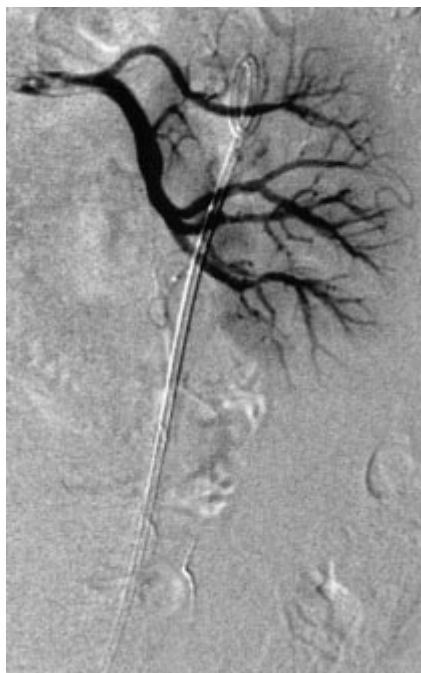
Abb. 3 Dokumentation der vollständigen Gefäß-Okklusion des ehemals von der unteren Polararterie versorgten Tumorastes nach Embolisation mit Partikeln und Gewebekleber.

18 Stunden später wurde der Druckverband entfernt und der Patient konnte nach Kontrolle seiner Laborparameter beschwerdefrei entlassen werden. Die Kontrolluntersuchungen mit Schienenwechsel – zuletzt ca. 6 Monate nach Embolisation – vergingen ohne Anhalt für erneute Blutungen. Der Patient empfand subjektives Wohlbefinden.