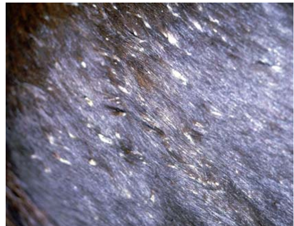
► Abb. 7 Dermatophilose als Differenzialdiagnose zur Mauke.

Der Keim wird mikroskopisch nach Abklatschprobe oder kulturell nachgewiesen.