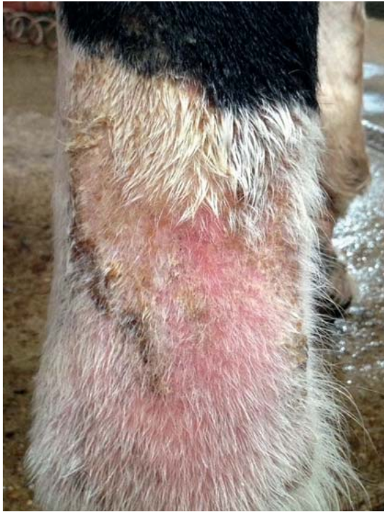
► Abb. 5 Lokale Rötung der Haut im Bereich der Fessel und des unteren Röhrbeins als Frühform der Mauke bei einem Warmblutpferd (Pferd aus ► Abb. 1 und 2 ).