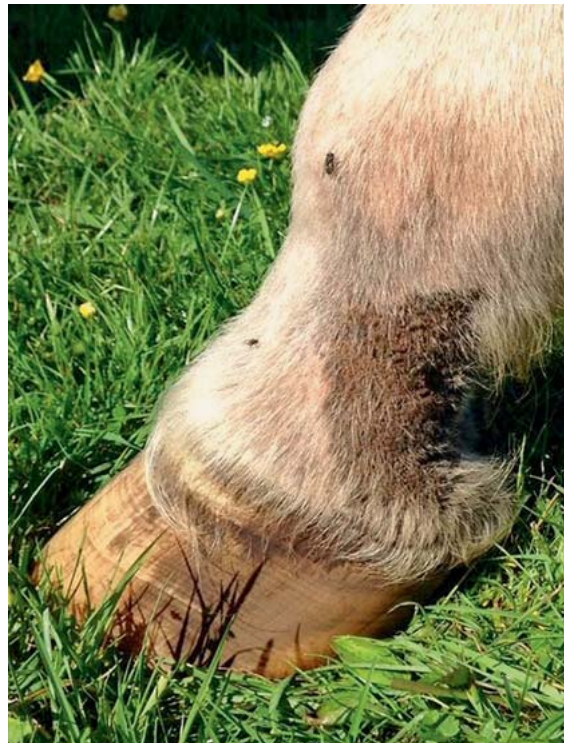
► Abb. 1 Krustöse Veränderungen im Bereich der Fesselbeuge bei einem Warmblutpferd.

Beim Kaltblut ist darüber hinaus eine Sonderform bekannt: die chronische Warzenmauke ( verrucous pododer-