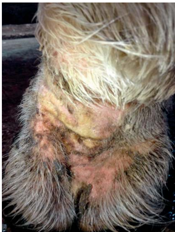
► Abb. 2 Exsudative Veränderungen in der Fesselbeuge bei einem Warmblutpferd im Bereich der weißen Abzeichen der Gliedmaße (Pferd aus ► Abb. 1 ).