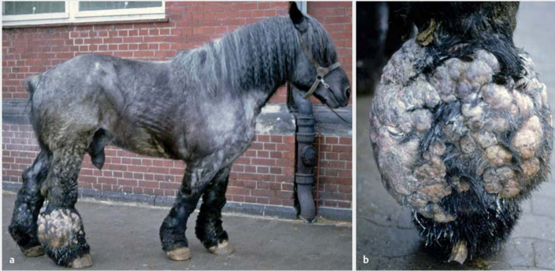
► Abb. 4 a Warzenmauke bei einem Kaltblut. © Klinik für Pferde, Stiftung Tierärztliche Hochschule Hannover. b Detailaufnahme. © Klinik für Pferde, Stiftung Tierärztliche Hochschule Hannover

Die klinische Präsentation kann grob in 3 Hauptformen unterteilt werden [2]: