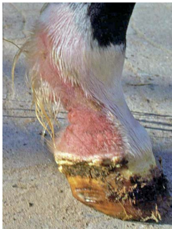
► Abb. 3 Dermatitis im Bereich der Fessel und Fesselbeuge, vermutlich bedingt durch eine leukozytoklastische Vaskulitis. Differenzialdiagnostisch kann diese durch eine medikamentelle Überempfindlichkeitsreaktion ausgelöst werden. Eine weitere Abklärung erfolgte mittels Biopsie.

matitis ). Bei der Warzenmauke führen unzureichende Lymphabflusssysteme der distalen Gliedmaße zu hochgradigen Schwellungen, zu Fibrosierungen, einer komprimierten Immunabwehr sowie sekundären Hautinfektionen [2, 5, 12].