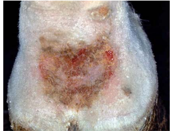
► Abb. 6 Mauke im Bereich der Fesselbeuge mit krustösen und leicht exsudativen Veränderungen.