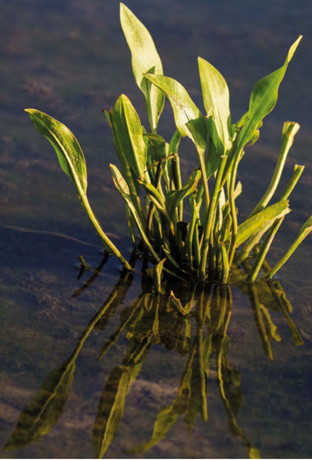
Abb. 1 Eine Pflanze aus der Gattung der Froschlöffel. Froschlöffelwurzel gelten in der TCM als Feuchtigkeit ausscheidendes und umwandelndes Arzneimittel.