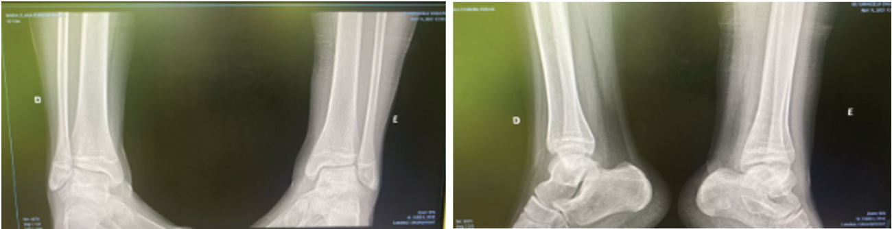
Fig. 3 Radiografia do tornozelo.

radiografia evidenciou remodelação óssea, sendo optado por retirada da imobilização. A paciente foi encaminhada à fisioterapia para reabilitação, com treino de marcha e carga parcial progressiva, fortalecimento muscular e ganho de amplitude de movimento. Nos meses subsequentes a paciente retornou para avaliação clínica, sem queixas algícas ou qualquer outra sintomatologia, recebendo alta do nosso Serviço, porém, ainda em acompanhamento com a oncologia pediátrica.