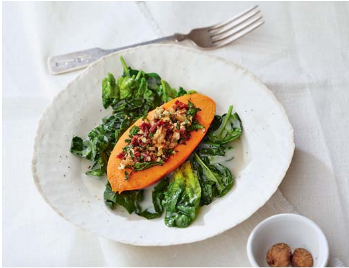
► Abb. 1 Süßkartoffeln und Spinat als Provitamin-A-Quelle.

Jährige bei 0,8–1 mg Retinol-Äquivalent pro Tag (laut DGE). Gute Vitamin-A-Quellen sind z. B. fettreiche Fische (Lachs u. a.), Eigelb, Grünkohl, Spinat, Süßkartoffeln, Möhren und Aprikosen (► Abb. 1 ).