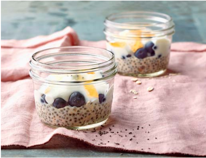
► Abb. 3 Pudding aus Chiasamen und Hirsemilch.

der Muskel- und Nervenfunktion. Die Daten einer umfangreichen, epidemiologischen Studie offenbaren, dass eine tägliche Kalziumzufuhr von unter 500 mg das parodontale Erkrankungsrisiko erhöht [31]. Im Zusammenspiel mit Vitamin D beeinflusst Kalzium den Knochenstoffwechsel, insbesondere auch des Alveolarknochens. Dieser scheint besonders sensibel auf ein Ungleichgewicht zwischen Mineralisierungs- und Demineralisierungsprozessen zu reagieren. Verstärkte Abbauvorgänge am Kieferknochen erhöhen wiederum das Risiko eines Zahnverlusts, sodass von Maßnahmen der Osteoporoseprophylaxe letztendlich auch das Parodont profitiert. Eine Optimierung der Kalziumzufuhr über geeignete Nahrungsmittel spielt dabei eine große Rolle (► Tab. 2 ). In Bezug auf Vitamin D weisen die Ernährungsgesellschaften daraufhin, dass in Deutschland die körpereigene Vitamin-D-Bildung vermutlich nur von April bis September den Bedarf decken kann, sodass in den Monaten Oktober bis März auf eine ausreichende orale Zufuhr geachtet werden sollte. Besonders reich an Vitamin D sind fettreiche Fische, danach folgen mit deutlich geringeren Mengen Leber, Eigelb, Milchprodukte und Champignons. Zur Sicherheit kann der Vitamin-D-Status im Blut bestimmt werden, wobei eine Calcidiolkonzentration von mind. 50 nmol/l als wünschenswert angesehen wird [32].