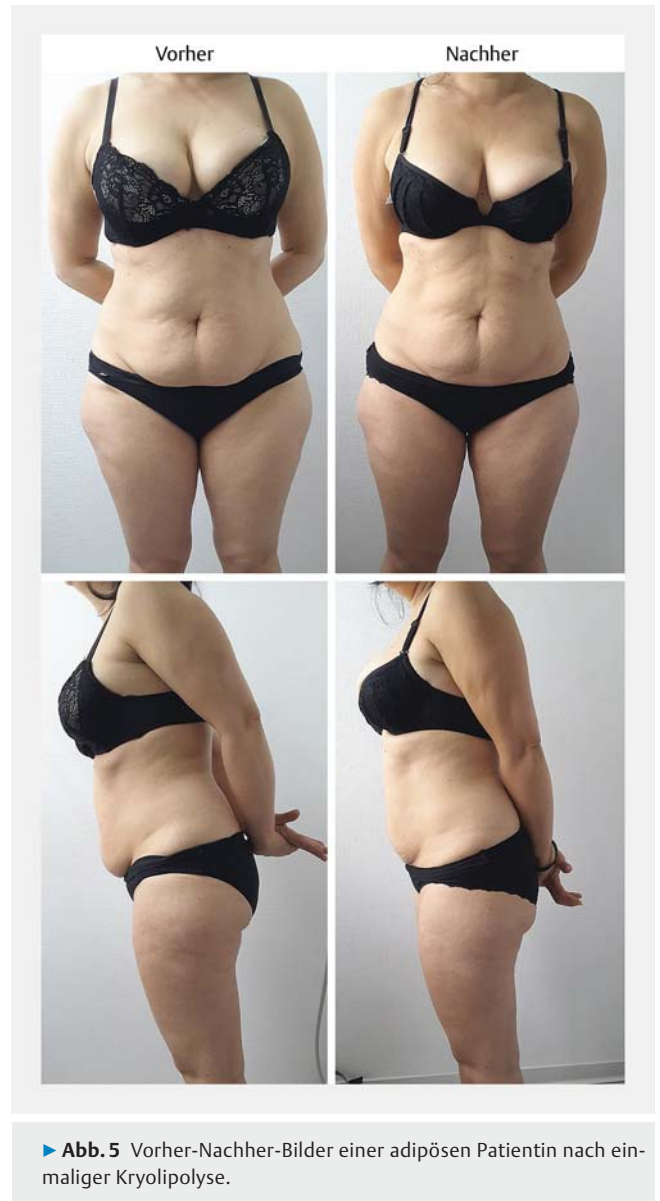
► Abb. 5 Vorher-Nachher-Bilder einer adipösen Patientin nach einmaliger Kryolipolyse.

Auch wenn die Kryolipolyse im Vergleich zur Liposuktion als sanfter, nebenwirkungsarme Methode angesehen wird, gilt wie überall in der Medizin: keine Wirkung ohne Nebenwirkung. Wie In-vitro-Studien zeigten, kommt es erst bei Temperaturen unter 4 Grad zur Kristallisation der Fetttropfen in den Adipozyten [9]. Um die gesamte, meist mehrere Zentimeter dicke Fettschicht abzukühlen, muss mit Temperaturen im Minusbereich gearbeitet werden. Dem Behandler steht nur ein schmaler „Temperatur-Korridor“ zur Verfügung. Bei zu geringer Kühlung