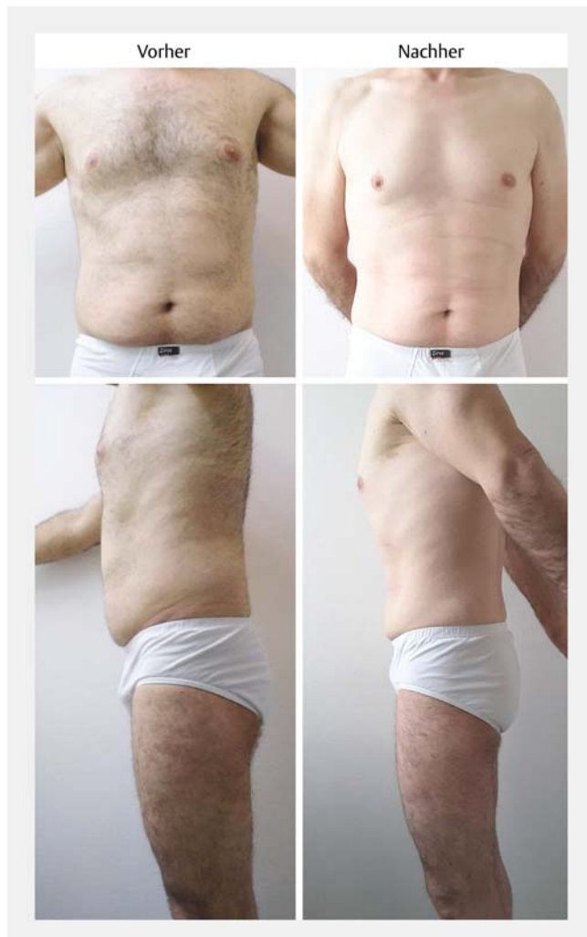
► Abb. 2 Vorher-Nachher-Bilder nach zweimaliger Kryolipolyse Bauch und Hüften.