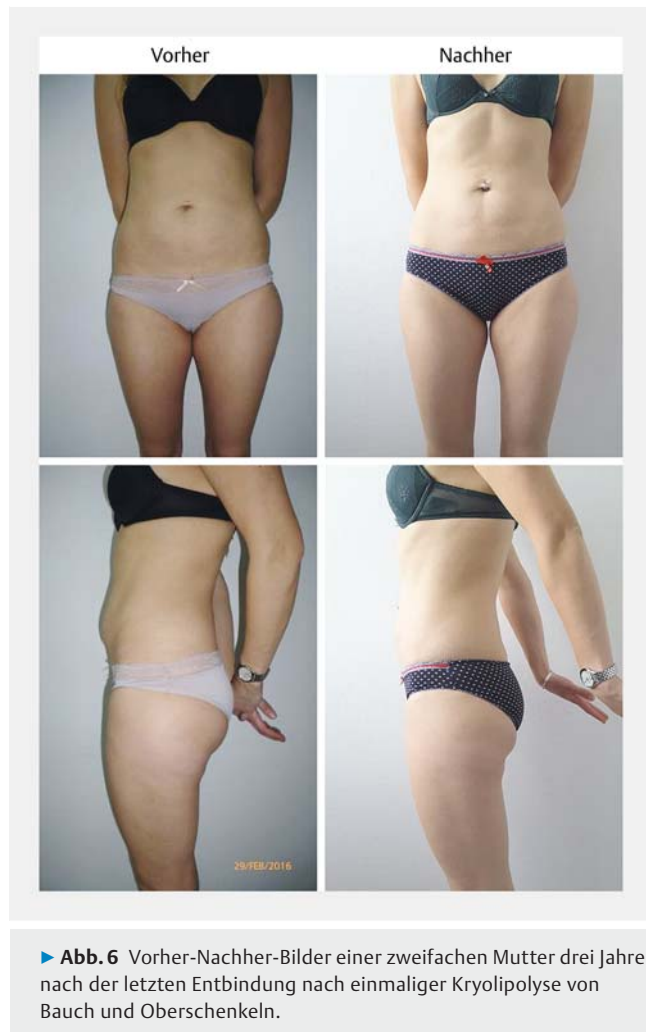
► Abb. 6 Vorher-Nachher-Bilder einer zweifachen Mutter drei Jahre nach der letzten Entbindung nach einmaliger Kryolipolyse von Bauch und Oberschenkeln.

Erstmals wies Manstein [15] tierexperimentell nach, dass Adipozyten mittels kontrollierter Kälteanwendung durch Apoptose zugrunde gehen. Ferraro [11] und Lee [23] bestätigten mittels histologischer und immun-histochemischer Untersuchungen an Gewebeproben von Menschen die im Tiermodell erhobenen Ergebnisse. Die MEDLINE- und Cochrane-gestützte Metaanalyse von 319 Publikationen durch Ingargiola [20] belegte geräteunabhängig eine durchschnittliche Reduktion des subkutanen Fettgewebes zwischen 10,3% bis 28,5%. Eigene Studien über 505 Behandlungen führten zu vergleichbaren Ergebnissen. Der Behandlungserfolg der Kryolipolyse tritt nicht sofort, sondern erst nach einer Latenz von ca. 3 Monaten ein und fällt individuell aus im Sinne einer Gauß'schen Normalverteilung: Bei einzelnen Patienten konnte bereits nach einer Kryolipolyse eine Reduktion der behandelten Fettpölsterchen um über 50% erreicht werden, bei ca. 10% der Patienten blieb nach der ersten Behandlung ein Erfolg aus. Nach Zweitbehandlung reduzierte sich die Non-Responder-Rate auf 5% [14]. Die durch die Kryolipolyse-Behandlung ausgelösten pathophysiologischen Vorgänge, die schlussendlich zur Apoptose von Adipozyten führen, verlaufen individuell unterschiedlich. Vermutlich kommt genetischen Faktoren eine entscheidende Rolle zu. Inwieweit sich z.B. aus dem Hauttyp nach Fitzpatrick prädiktive Parameter ableiten lassen, müssen weitere Studien zeigen. Unklar