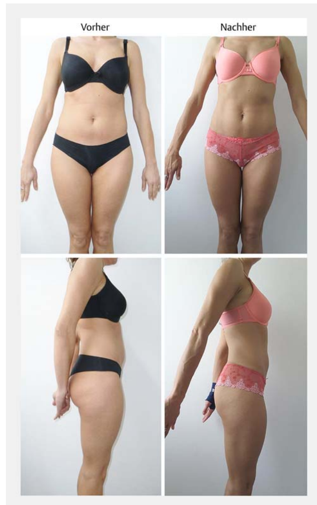
► Abb. 3 Vorher-Nachher-Bilder nach einmaliger Kryolipolyse Bauch und Hüften.

chen, sich auf dem deutschen Markt zu positionieren. In unserem Zentrum wurden Behandlungen mit CoolSculpting (Zeltiq), Kryokontur (LaserPoint International, Deutschland), KryoShape (Medical Shape GmbH, Schweiz) sowie Crystal (Deleo, Frankreich) durchgeführt. Momentan behandeln wir mit drei Geräten der Firma Medical Shape und einem Gerät der Firma Deleo.