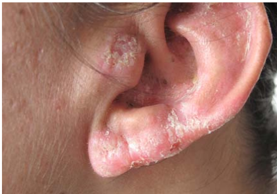
► Abb. 1 Ohrmuschel links: infiltrierte schuppende Erytheme mit narbigen Einziehungen.

34-jährige Patientin serbischer Herkunft mit Fitzpatrick-Hauttyp IV. Am Nasenrücken, an der Wange und an der Ohrmuschel links verrukös überlagerte infiltrierte Erytheme mit narbig veränderter Oberflächenkontur (► Abb. 1 ).