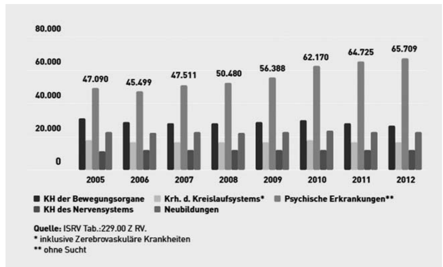
► Abb. 1 Renten wegen Erwerbsminderung: Ausgewählte Indikationen 2005–2012.

Um neue Therapieansätze und Möglichkeiten herausarbeiten zu können, müssen sowohl die akademische Psychiatrie als auch die Industrie in die Pflicht genommen werden, ihren Teil zur Weiterentwicklung therapeutischer Ansätze bei psychischen Erkrankungen beizutragen.