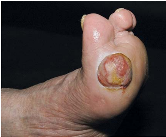
► Abb. 2 Amelanotisches Melanom.

Bei disseminiertem Befall stehen zusätzlich mit den nicht zytotoxischen Molekülen Interferon \alpha und Bexaroten 2 sehr wirksame Substanzen zur Verfügung. Mit der Kombinationstherapie gelingt es in mehr als 60% der Fälle, eine Erscheinungsfreiheit zu erzielen.