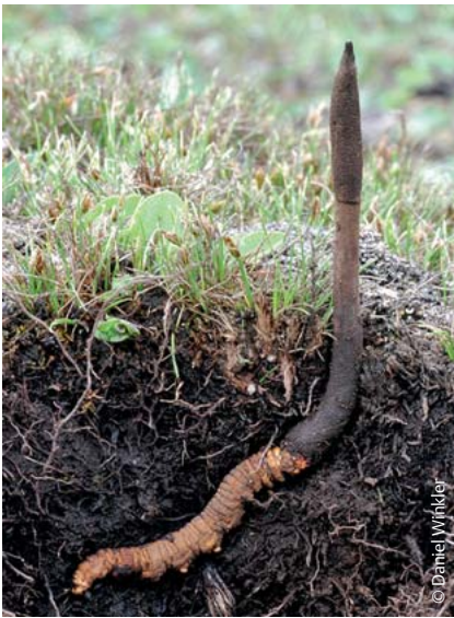
Abb. 1 Cordyceps mit Raupe.