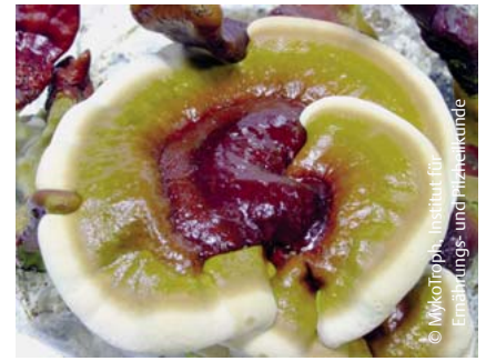
Abb. 3 Reishi – glänzender Lackporling.

Cordyceps sinensis hat sein natürliches Vorkommen im tibetischen Hochland auf 3000 bis 5000 Metern. Er wächst auf einer Raupenart und treibt aus dieser seinen Fruchtkörper. Aufgrund dieses Umstandes ist der Anbau in Deutschland verboten, d. h. Cordyceps-Präparate sind immer importiert. Aus Sicht der TCM unterstützt Cordyceps die Niere, er speichert Energie, verleiht Kraft und Ausdauer, und gilt daher als Wurzel des Lebens. In Studien wurde nachgewiesen, dass der Leberstoffwechsel verbessert und der Gallefluss angeregt wird. Eine Stunde nach Verabreichung kommt es zu einer dosisabhängigen Erhöhung der Kortikosteroide. Die Aktivität der natürlichen Killerzellen wird erhöht. Über ein Stimulieren der Peyer'schen Platten wird das Immunsystem angeregt. Der Inhaltsstoff Cordycepin hat eine antibiotische Wirkung gegen Clostridium perfringens und Clostridium paraputrificum [2].