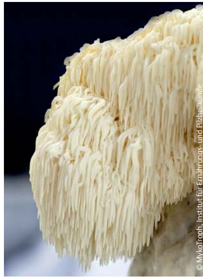
Abb. 2 Hericium – Igelstachelbart.

Bei Hunden mit rezidivierender Diarrhoe, die mehrfach mit Antibiose und Cortison behandelt wurden, hat sich neben einer konsequenten Futterumstellung die Unterstützung der Darmschleimhautregeneration mit einer Mischung aus Hericium und Pleurotus bewährt. Grundsätzlich muss wegen der starken entgiftenden Wirkung der Pilze mit einer sehr geringen Dosierung begonnen werden (ca. ¼–½ Kapsel/Tag), da es sonst zu weiterer Diarrhoe als Ausscheidungsreaktion kommt. Die Dosis wird alle paar Tage auf bis zu 1–