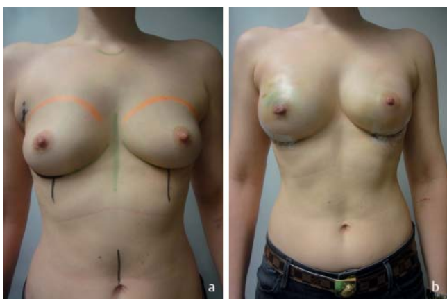
► Abb. 4 31-jährige Patientin mit TNBC, BRCA-1-positiv, Z. n. primärer Chemotherapie mit bildgebender Komplettremission. Präoperativ und 10. postoperativer Tag nach beidseitiger subkutaner Mastektomie, SLNB rechts mit Sofortrekonstruktion durch präpektoriale Implantateinlage. Ein augmentativer Aspekt war gewünscht.

einlage und Tiloop®Bra-Bedeckung eingeschlossen und ausge-