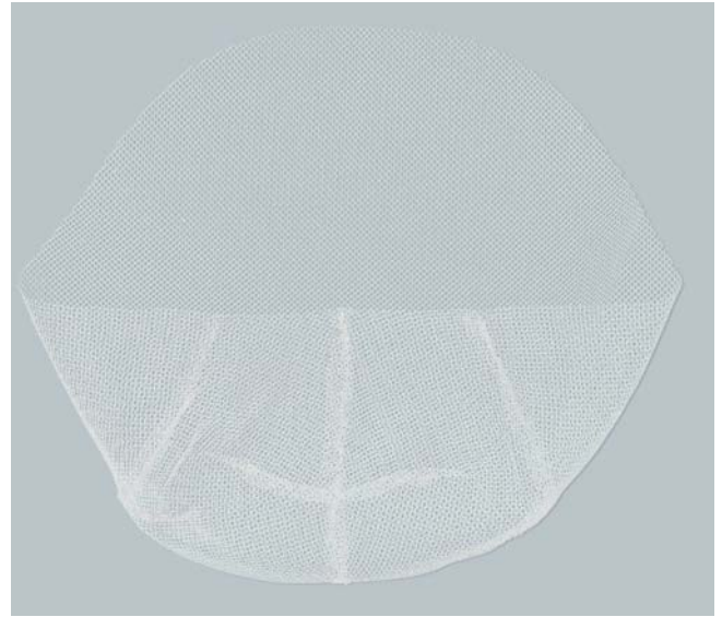
► Abb. 2 Speziell für die präpektoriale Implantateinlage gefertigtes synthetisches Netz (TiLoop® Bra-Pocket).

So nimmt nach unserer Erfahrung die präpektoriale netzunterstützte Implantateinlage nach ersten Überlegungen und Operationen insgesamt kontinuierlich zu. Dies liegt zum einen an der