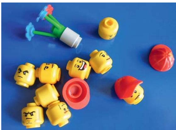
► Abb. 2 Köpfe oder alle anderen „Einerle“ eignen sich.