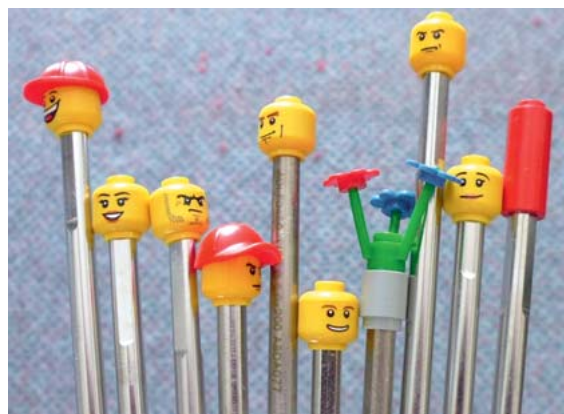
► Abb. 3 Parade von aufgesteckten Endkappen mit lachenden oder grimmigen Köpfen, Blumen oder auch einfachen Steinen.

DOI https://doi.org/10.1055/s-0043-108808 OP-JOURNAL 2018; 34: 69 © Georg Thieme Verlag KG Stuttgart · New York ISSN 0178-1715