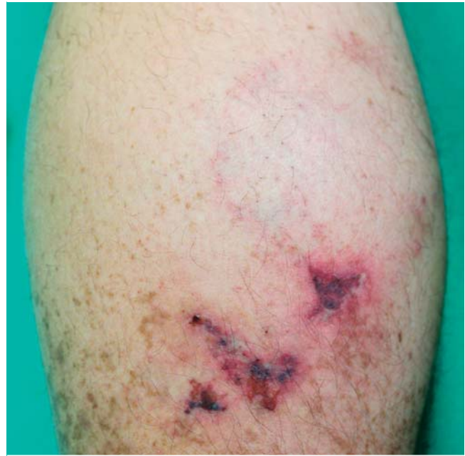
► Abb. 1 Hautbefund der Wade mit Livedozeichnung und Ulzerationen vor Beginn der Therapie.

Nach aktueller Studienlage [6] leiteten wir eine Antikoagulation mit Rivaroxaban (Xarelto®) 10 mg zweimal täglich ein. In Kombination mit einer desinfizierenden Lokaltherapie zeigte sich bereits im stationären Verlauf eine Besserung des Hautbefundes und der Schmerzsymptomatik. Die Dosis des Rivaroxaban wurde nach Sistieren der Schmerzen auf 10 mg einmal täglich reduziert. Diese Dosis wird seither als Dauertherapie fortgeführt. Drei Monate nach Entlassung stellte sich der Patient im Rahmen einer Nachkontrolle erneut bei uns vor. An der Wade zeigte sich narbig, atrophierte Haut ohne frische Ulzerationen oder Erytheme (► Abb. 2 ). Schmerzen wurden vom Patienten verneint.