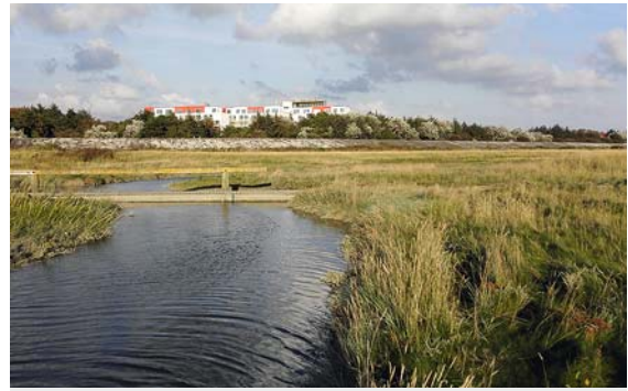
► Abb. 3 Rehakliniken liegen meist in ländlichen Urlaubsregionen. Der räumliche Abstand von den Alltagsproblemen und die Nutzung von günstigen Klimaregionen unterstützen die Abheilung des Ekzemleidens.

Empfehlenswert für die Rehabilitation des atopischen Ekzems ist eine Klimaregion, die Inflammation und Pruritus positiv beeinflusst. Zu vermeiden ist sommerliche schwüle Hitze, bei Soforttyp-Allergikern auch stärkere Allergenbelastung durch Pollenflug. Klimatisch günstige