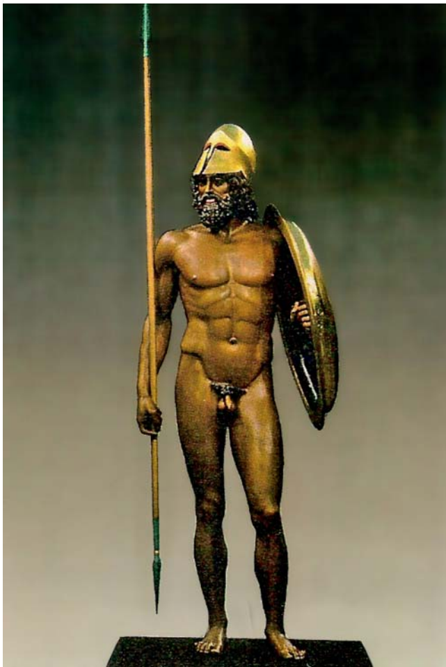
► Abb. 1 Krieger Riace A, restauriert, soll den mythologischen Athener König Erechtheus darstellen, Bronze, Höhe 198 cm, Museo Reggio di Calabria, Original um 440 v. Chr. Er ist nicht kleiner als Statue Riace B, der Größenunterschied ist fotografisch bedingt.