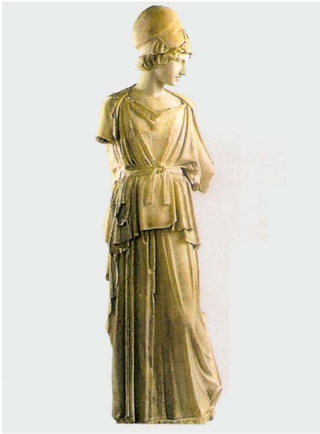
► Abb. 3 Dieselbe Art des Helmes wie in ► Abb. 1 bei der athenischen Schutzpatronin, der Göttin Athene, sog. Athena des Myron, Liebieghaus Frankfurt. Kopie aus den Gärten des Lukullus, Rom, augusteische Zeit. Auch hier der Eindruck von Weisheit und Klugheit (bei mädchenhafter, gänzlich unmilitärischer Schönheit. Schönste Darstellung der Athena nach Ansicht des Frankfurter Liebieghauses) (Bild: © Liebieghaus Skulpturensammlung – ARTOTHEK).

typischen androgenetischen Alopezie bei stark erhaltenem bügelartigem Haarkranz dorsal und Kahlheit nur auf der Kopfmittle ist sehr einleuchtend und wird noch untermauert durch ein weiteres Detail, nämlich dass „die Helme hinten zwischen Filz und Metall mit in Reihen angeordneten Tierhaaren besetzt werden“ ([3], S. 67). Diese fungieren für den Glatzenhelm also gleichsam als bügelartiger erhaltener Haarkranz. Schamhaft verborgen unter einem Efeukränzchen ist diese Glatzenform ganz typisch z. B. bei der mythologischen Figur des Silenos auf Vasenbildern zu sehen.