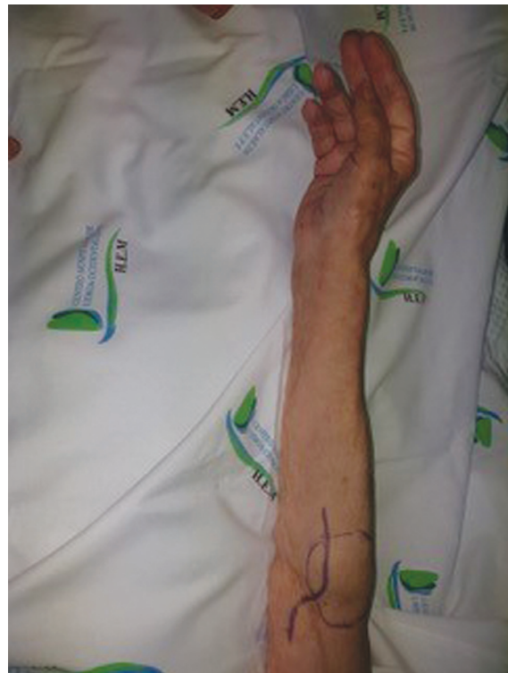
Fig. 11 Comparación posoperatoria con la mano izquierda.