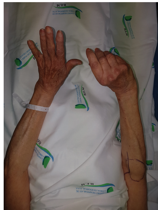
Fig. 2 Vista volar preoperatoria.