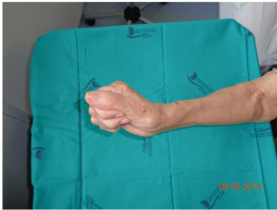
Fig. 8 Flexión posoperatoria.