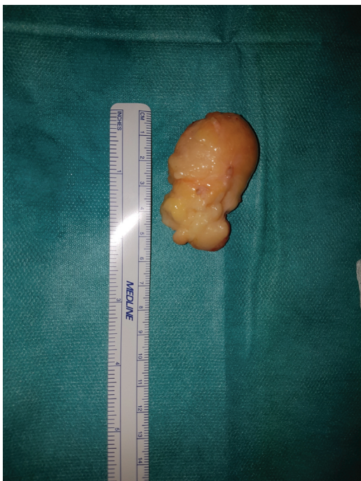
Fig. 5 Lipoma del NIP intraneural intraoperatorio.

Después de 3 meses de rehabilitación, se logró una recuperación total con extensión completa de los dedos y fuerza contra resistencia mantenida (puntaje de 5/5 en la Escala del Consejo de Investigación Médica para la Fuerza Muscular) (► Figs. 8-11 y ► Video 1 ).