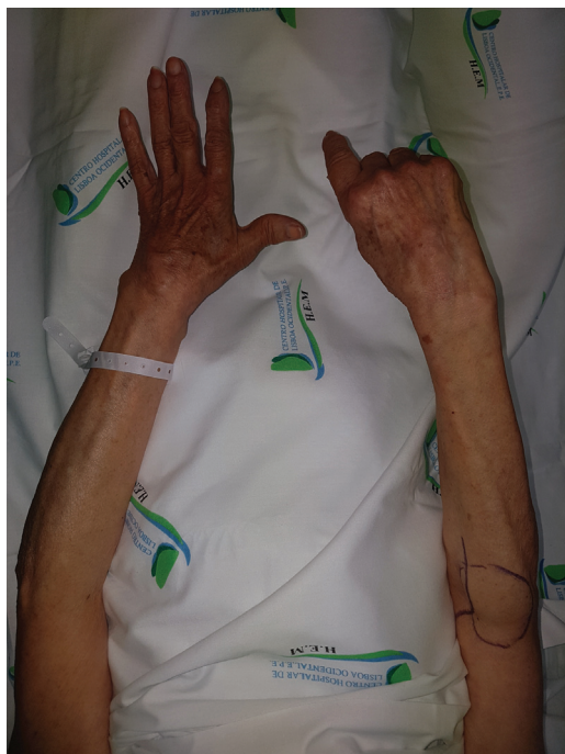
Fig. 1 Vista dorsal preoperatoria.

Elegimos un abordaje posterolateral modificado con una incisión en forma de S. Intraoperatoriamente, pudimos identificar fácilmente el NIP, y se identificó y se extirpó totalmente un lipoma intraneural englobado en las fibras