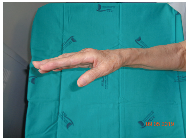
Fig. 7 Lipoma.