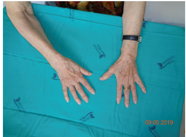
Fig. 6 Lipoma del NIP intraneural intraoperatorio.