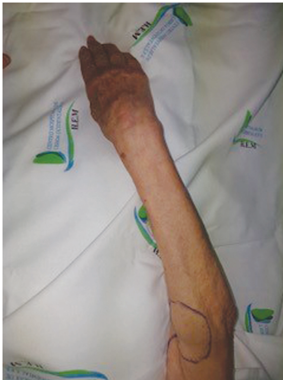
Fig. 10 Cicatriz postoperatoria.